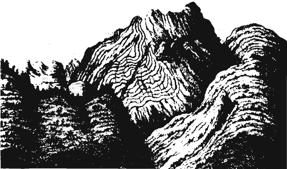
Fig. 1. Vista del pic Gabedaille o L'Espélunguère (montaña de Acué) en la divisoria entre el valle del Aspe y el del Aragón Subordán, según un grabado contemporáneo que aparece en el libro de PALASSOU Essai sur la Minéralogie des Monts Pyrénées... , de 1784. Todo el paisaje está modelado en la arenisca roja; nótese también cómo el artista resalta la dirección y buzamiento de las capas y el plegamiento de las mismas.

Murchinson, Verneuil y Keyserling. Por ser una formación continental, con escasísimos fósiles y localizada en un contexto tectónico complicado, la datación y correlación fueron problemáticas desde el principio. Este artículo examina la evolución de la estratigrafía de la grès rouge pyrénéen (arenisca roja pirenaica) durante el siglo XIX, centrándose específicamente en las aportaciones generadas por el estudio de los afloramientos del Alto Aragón y Alto Béarn. Puesto que las fuentes consultadas han sido exclusivamente las publicaciones científicas y tampoco se ha perseguido una recopilación exhaustiva, este estudio no pretende en modo alguno abarcar todas las complejidades de la actividad geológica en el Pirineo durante el siglo XIX; su intención, más modesta, es mostrar algunas pautas de esa historia tal y como se filtran a través de una revisión crítica y comentada de los escritos científicos.