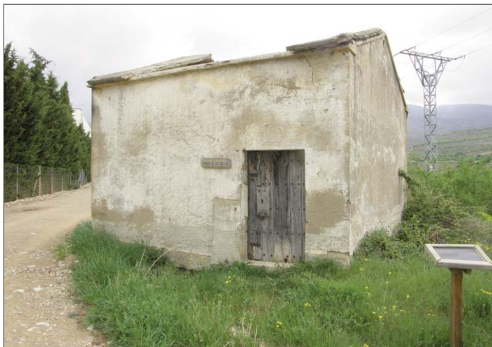
Fig. 4. Edificio del partidor de Arascués (23 de abril de 2011).

Probablemente del mismo tiempo es su edificio protector, que se muestra en la figura 4. Es una edificación modesta, en tapial. Está reconstruido parcialmente con materiales modernos, quizás tras la Guerra Civil. En los últimos meses su techo se ha hundido y todo hace suponer una rápida ruina.