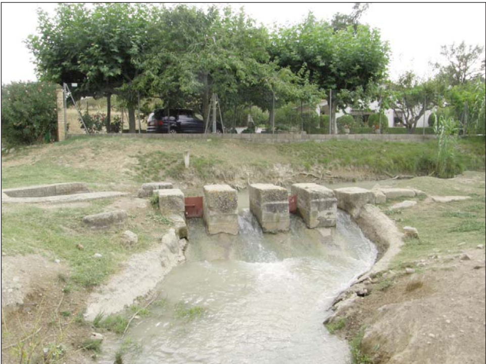
Fig. 3. Partidor de Cortés, en el sistema de riegos del pantano de Arguis.

Este artículo se centra en un singular partidor, existente en el término municipal de Arascués, que fue construido a inicios del siglo XVII. En el Archivo Histórico Provincial de Huesca figura el contrato con el cantero Juan de Balen por 920 sueldos, firmado el 26 de marzo de 1603 (AHPH, Sebastián Canales, prot. 704).