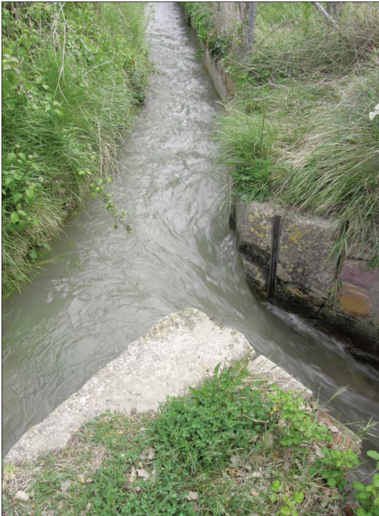
Fig. 1. Partidor en la Cruz del Palmo, en el sistema de riegos del pantano de Arguis.

Su origen es antiguo, sin que se pueda precisar dónde comenzaron a utilizarse. GUINOT (2008) considera que los existentes en Valencia, llamados llengües , tienen sus orígenes en el período islámico.