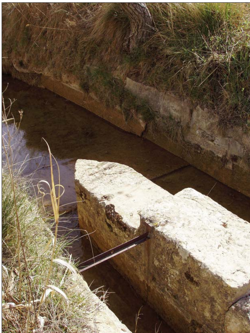
Fig. 2. Partidor de la Santeta, en la ribera del Flumen.

En la zona de Huesca todavía se usan en los sistemas del pantano de Arguis y la ribera del Flumen, donde hay alguna evidencia de riegos de época romana (REY y cols., 2000; CUCHÍ, 2005). La figura 1 presenta un partidor en el sistema de Arguis, en las cercanías de la Cruz del Palmo, en Huesca. La figura 2 muestra el tercio de la Santeta, que divide aguas entre las acequias de Quicena y de la ribera del Flumen, en el término municipal de Quicena.