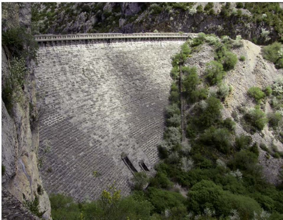
Fig. 2. Cara exterior del pantano de Santa María de Belsué. El cuerpo central aparece como diferente al resto. Mayo de 2025.

sumado a las galerías de la presa y los dos tubos de riego, daría un caudal de 285,40 metros cúbicos por segundo, “doble de la máxima avenida observada”. Calcula que, a embalse lleno, este se podía vaciar en treinta y nueve horas. Se proyectó también una ataguía para proteger los trabajos.