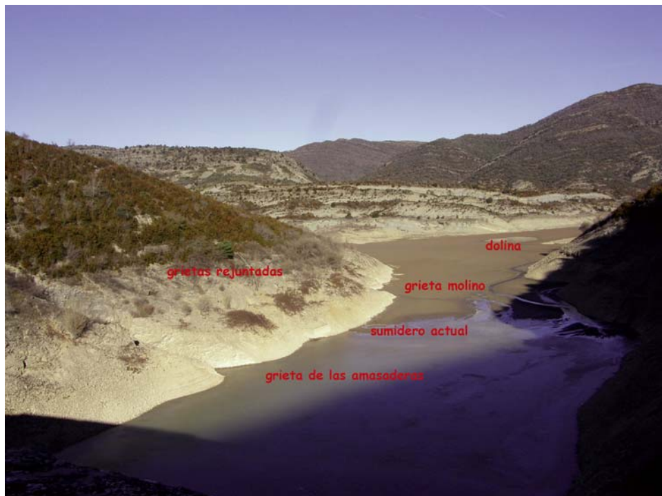
Fig. 9. Depresiones, simas y sumidero en la orilla derecha del embalse de Belsué. Diciembre de 2012.