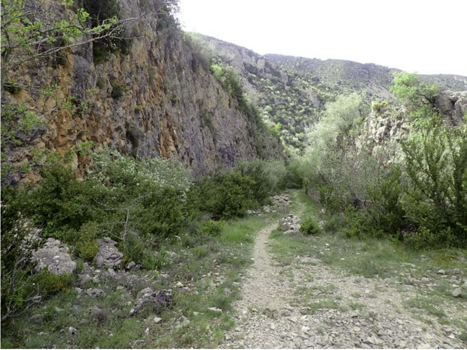
Fig. 5. Aliviadero del embalse de Santa María de Belsué. Mayo de 2025.

carretero más cercano era la localidad de Nueno, donde finalizaba en esta época la carretera a Arguis. La distancia hasta el lugar de la presa era considerable, por lo que se valoraba incluso la posibilidad de construir un cable aéreo. El proyecto, de 1906, valoraba dos soluciones, por 103 643,45 y 110 402,49 pesetas respectivamente. Mantecón se decantó por la construcción de la actual carretera por Sabayés, Santa Eulalia la Menor, collado de Salto de Roldán, fuente de San Mamés y Paco As Lianas. Según El Diario de Huesca del 14 de marzo de 1906, el presupuesto era de 64 321,15 pesetas. Esta carretera también podía servir para la construcción de la presa de Salto de Roldán. Lucien Briet indica que 486 jornaleros hicieron la actual carretera, de 22 kilómetros de longitud y 4,5 metros de anchura, en 22 días. Al final, el precio de la obra fue de 133 253,70 pesetas y se precisaba que serían necesarios entre 4 y 8 peones camineros para su mantenimiento. La carretera se inauguró el 22 de mayo de 1906, con la asistencia de Wenceslao Retana, gobernador civil; Julio Sopena y Ricardo Lapetra, presidente y vicepresidente de la Diputación