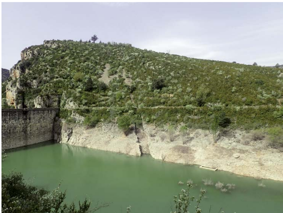
Fig. 6. Traza del plano inclinado construido por el ingeniero Cleto Mantecón. La casa de administración estaba junto al árbol de la zona superior.

Uno de los temas polémicos, como ya se ha señalado, fue el coste del transporte de diverso material desde Huesca, donde se encontraba la estación de ferrocarril más cercana. Se estimaba en algún momento en 7000 toneladas, sobre todo de cemento, lo que había de transportarse, y se dudaba