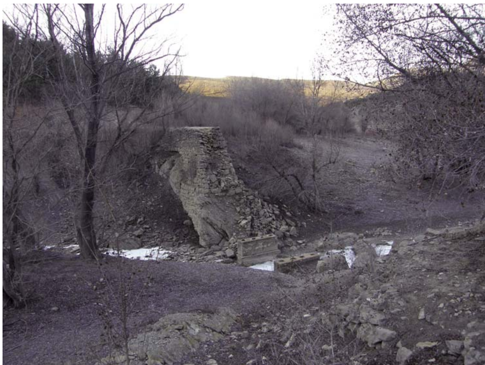
Fig. 7. Puente para vagonetes desde la cantera en Santa María de Belsué. Febrero de 2012.