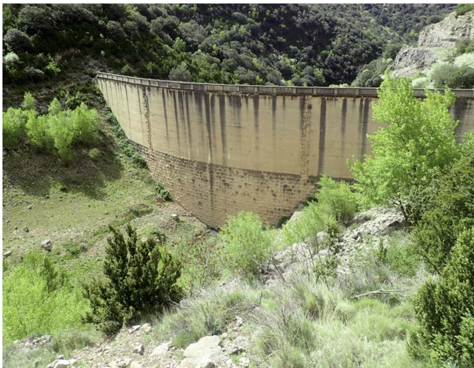
Fig. 3. Presa de Cienfuens. Se observan las dos fases, la inferior en mampostería y la superior en hormigón. Vaciado desde hace varios años, el vaso ha sido ya colonizado por la vegetación. Mayo de 2025.

un documento de la entonces Mancomunidad Hidrográfica del Ebro, firmado por Félix de los Ríos, nuevo ingeniero director, se dice que “La obra está ya terminada y en explotación, pero requiere obras complementarias destinadas a impermeabilizar el vaso, las cuales se están llevando a cabo con resultado satisfactorio” (AHPHu, BOLEA/00055_0002/0005). El mismo informe señala que para Belsué se ha pagado cemento por valor de 248 022,30 pesetas. Hoy ambas presas figuran en CHE (1976).