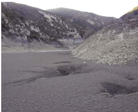
Fig. 11. Sumideros en la orilla derecha del vaso. Enero de 2012.