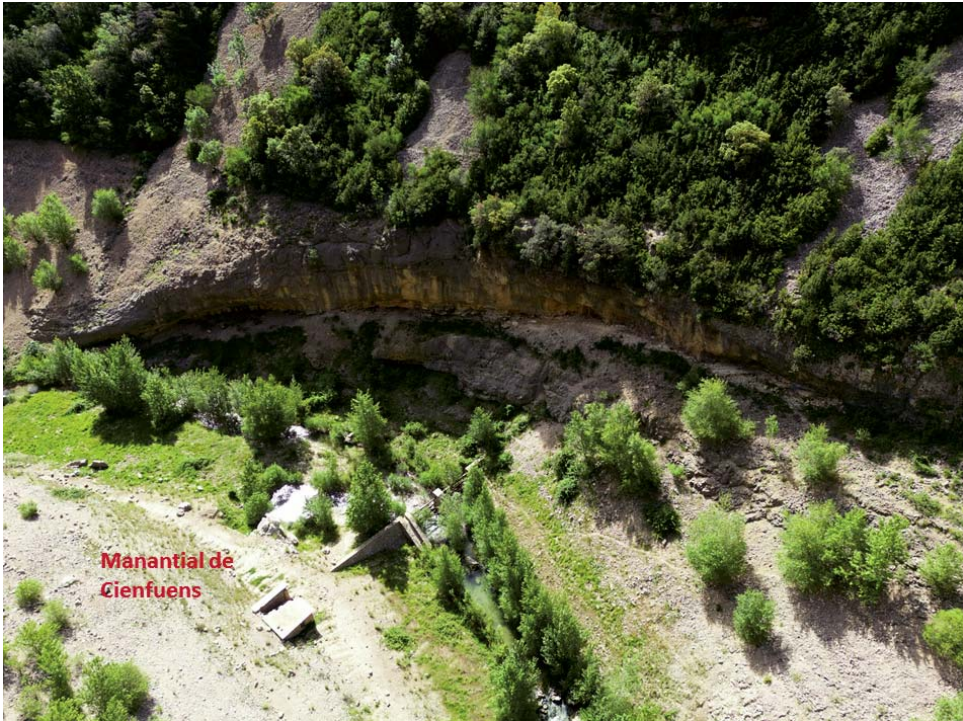
Fig. 8. Manantial de Cienfuens. Mayo de 2025.

como sucede en el embalse de Arguis con la cavidad de Sanclemente (Gimeno y Cuchí, 1996). Pero, en la práctica, actúa como zona de descarga de las pérdidas del vaso superior. En los documentos del embalse hay datos de aforos dos veces al día de esta surgencia y de todas las entradas al embalse. Hay un perfil de aforo aguas arriba de la surgencia y una estructura con apariencia de presa provisional justo aguas abajo.