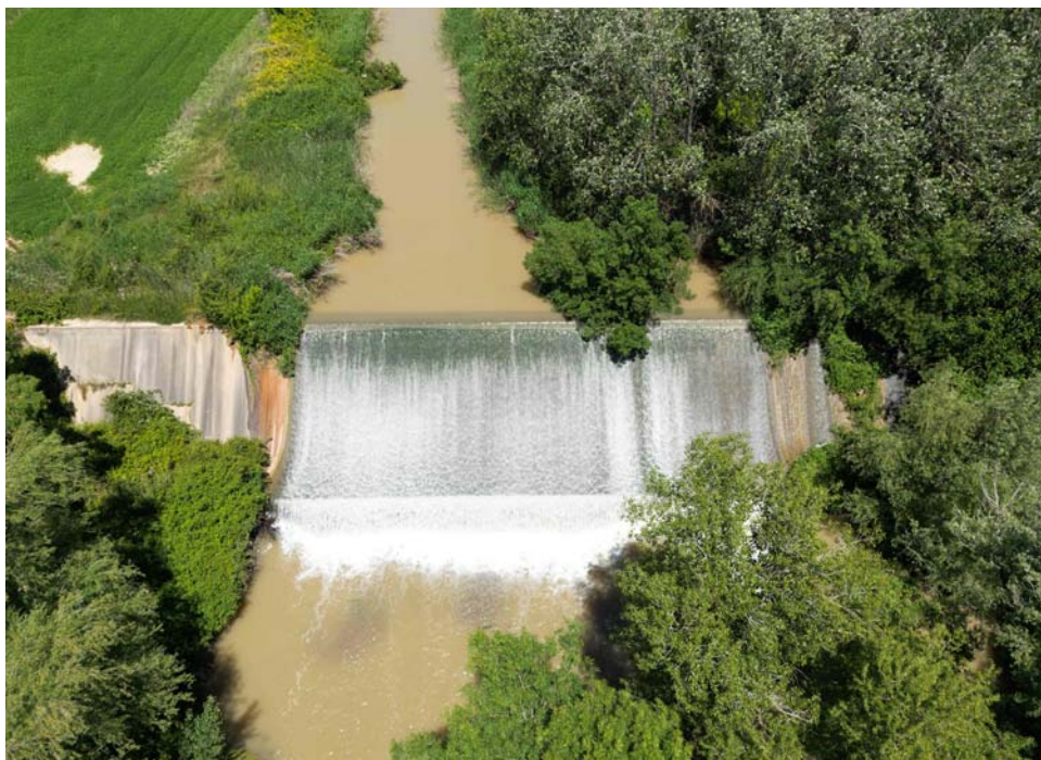
Fig. 4. Azud del Flumen en el Escalerón (Barbués). Mayo de 2025.

Como señala el citado Balaguer (1958), tras el fracaso de los embalses en la zona superior se volvió a considerar la idea de almacenar agua en Salto de Roldán. El Ayuntamiento de Huesca solicitó en 1951 un estudio geológico que se decantó hacia un embalse en el cañón inferior. Esta es la historia del embalse de Montearagón. Los testigos de los sondeos de una primera iniciativa estaban en el molino de Loporzano. Aún es pronto para describir la historia de este embalse, construido entre 1995 y 2006, con una reforma en 2013.