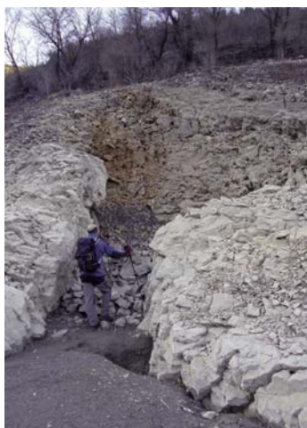
Fig. 10. Sumidero del molino. Enero de 2012.