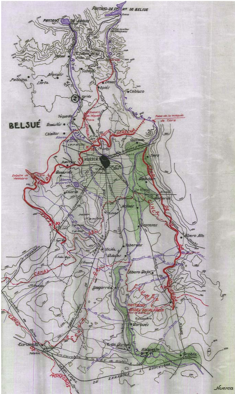
Fig. 12. Plano de canales de la presa del Flumen.