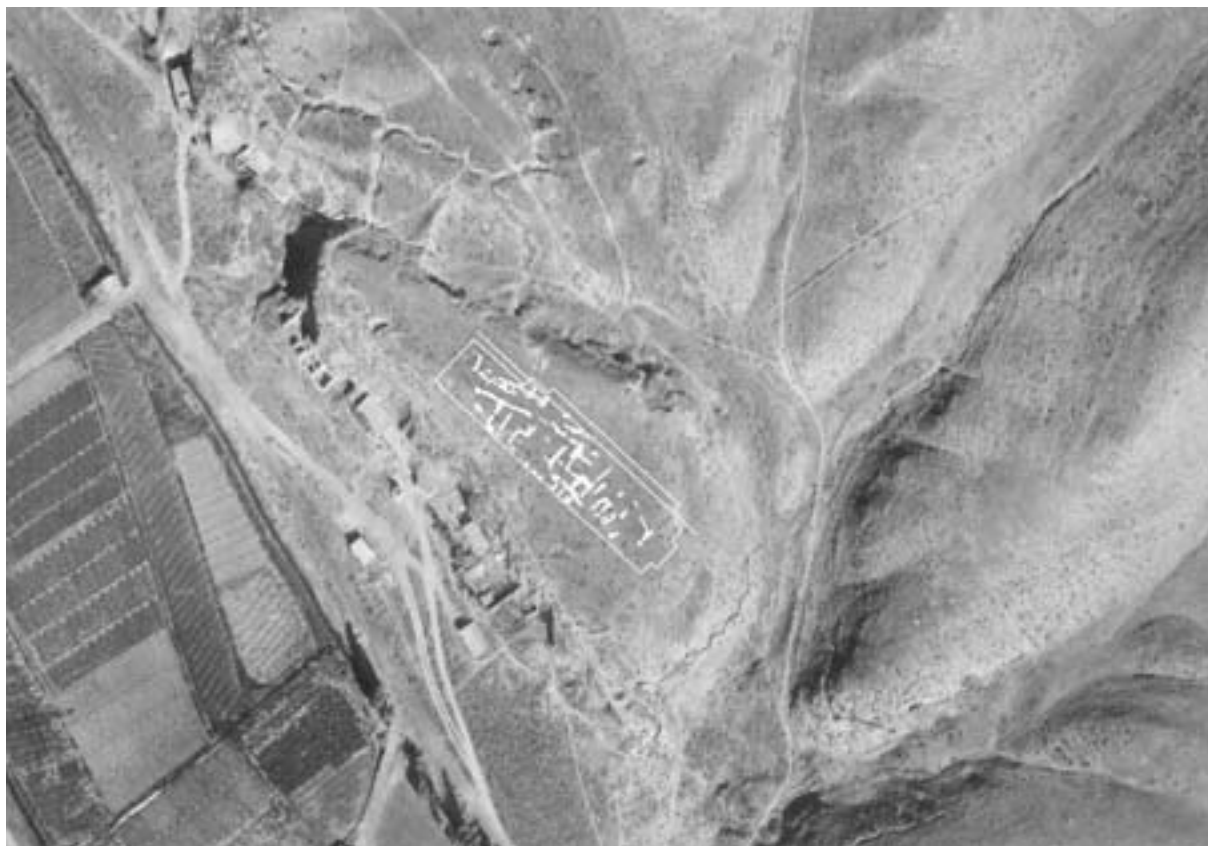
Fig. 3. Yacimiento del cerro de la Gavia. Fase I (escala 1:1500).

molienda situada a la entrada. En las fases anteriores esta se situaba en el centro de la estancia.