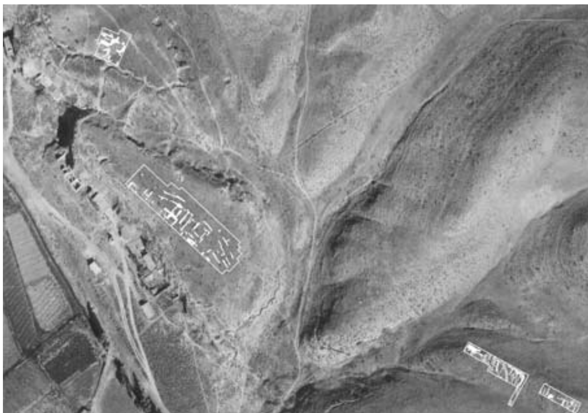
Fig. 2. Yacimiento del cerro de la Gavia. Fase II (escala 1:1500).

estructuras hayan aprovechado por relevación de muros el planteamiento de la etapa anterior, lo que hace muy difícil el reconocimiento de las estructuras asociadas a la misma.