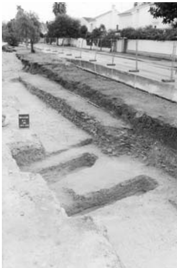
Fig. 1. Vista general de las unidades funerarias y el testar del alfar púnico del yacimiento de Villa Maruja.

La escombrera de mayor tamaño excavada de estos testares cerámicos es la ubicada entre los pp. kk. 220 y 229 (fig. 1). Este vertedero ha podido ser excavado en un espacio máximo de 4 m y en toda su longitud. Esta escombrera ha deparado interesantes materiales anfóricos, pero también otros elementos hasta ahora no documentados entre las producciones locales del entorno gaditano, como son las máscaras de terracota. En este sentido, en el estrato denominado nivel II , pudimos hallar un molde casi completo de una máscara con rasgos negroides, similar a la loca-