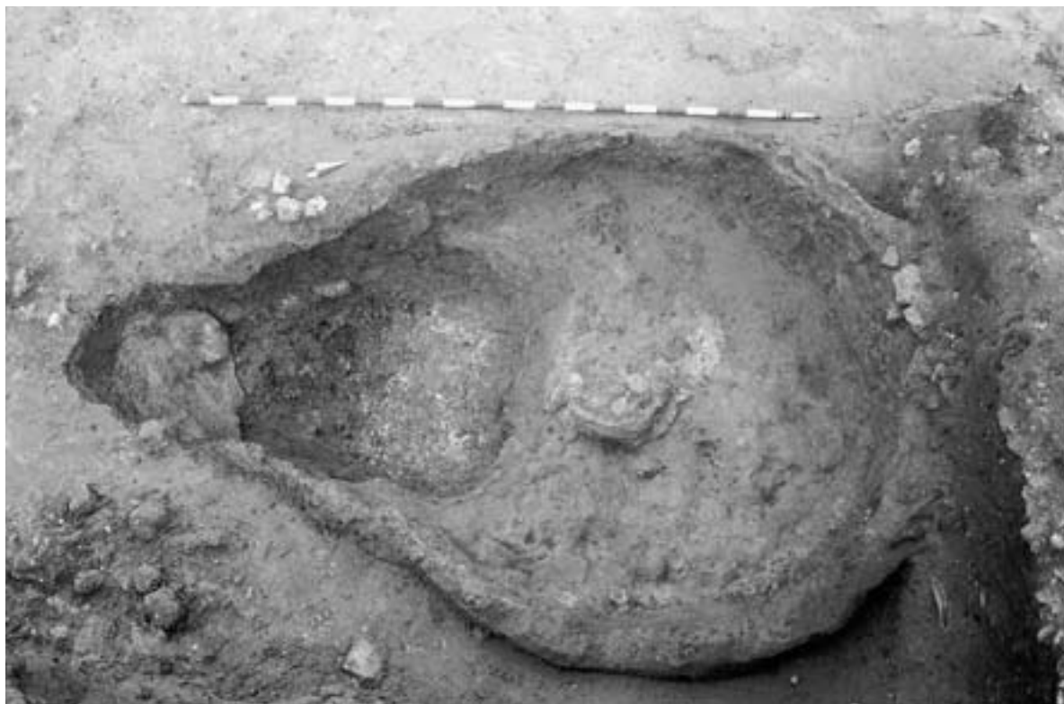
Fig. 3. Horno alfarero púnico de La Milagrosa (finales siglo III – primera mitad del II a. C.).

tal. Junto con este combustible, en el horno se documentó una concentración de diversos individuos malacológicos que presentaban signos de termoalteración. Ante esto, hemos apostado por una multifuncionalidad de esta estructura de combustión, que podría haberse dedicado también a la manufactura de cerámicas de pequeño tamaño. Se trata de una de las primeras ocasiones en las cuales se publica una estructura de combustión doméstica de estas características en la bahía de Cádiz, cuya multifuncionalidad es muy probable.