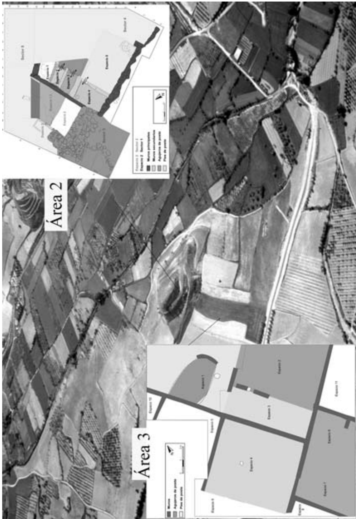
Fig. 2. Planimetría de las áreas 2 y 3.