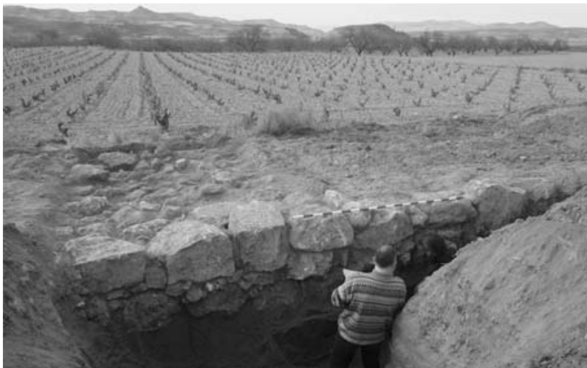
Fig. 3. Muralla de Segeda I con el Poyo al fondo.

debajo de la elevación del Poyo. Los materiales arqueológicos descubiertos no contradicen la cronología dada al abandono de esta ciudad en el 153 a. C. (BURILLO, 2001-2002b; CALVO, 2001-2002, y CANO et alii , 2001-2002).