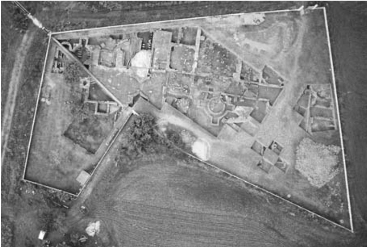
Fig. 1. Fotografía aérea del yacimiento de El Saucedo (Talavera la Nueva, Toledo).

Las monedas que presentamos en este congreso, todas ellas acuñadas en bronce, fueron documentadas en las campañas de excavación llevadas a cabo entre los años 2001 y 2002. Al año 2001 corresponden once de los doce ejemplares estudiados. Todos los ejemplares recuperados ofrecen un estado de conservación muy malo, por lo que no es posible adscribirlos a ningún emperador en concreto; quizá la número 1 del catálogo podría corresponder al emperador Adriano y la número 7 al emperador Honorio, sin poderse precisar las cecas donde fueron emitidas. Con respecto a las cronologías que nos ofrecen los numismas aquí presentados, podemos concluir lo siguiente: