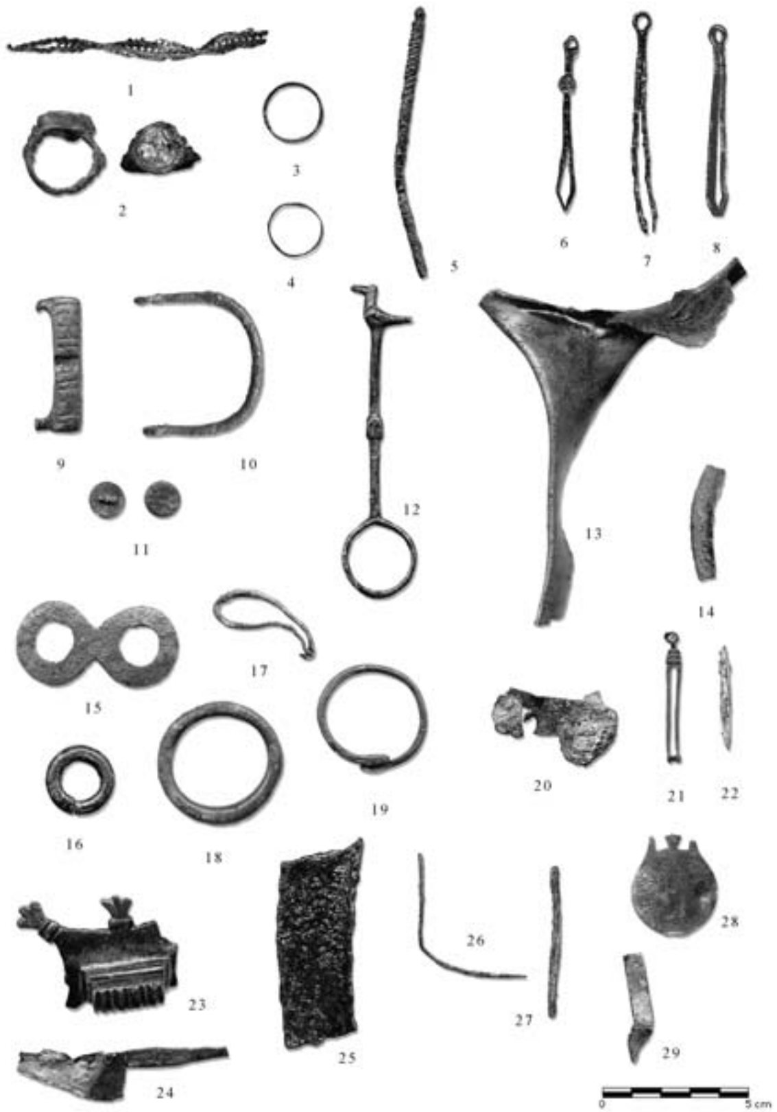
Fig. 3. Piezas de bronce procedentes de El Saucedo.