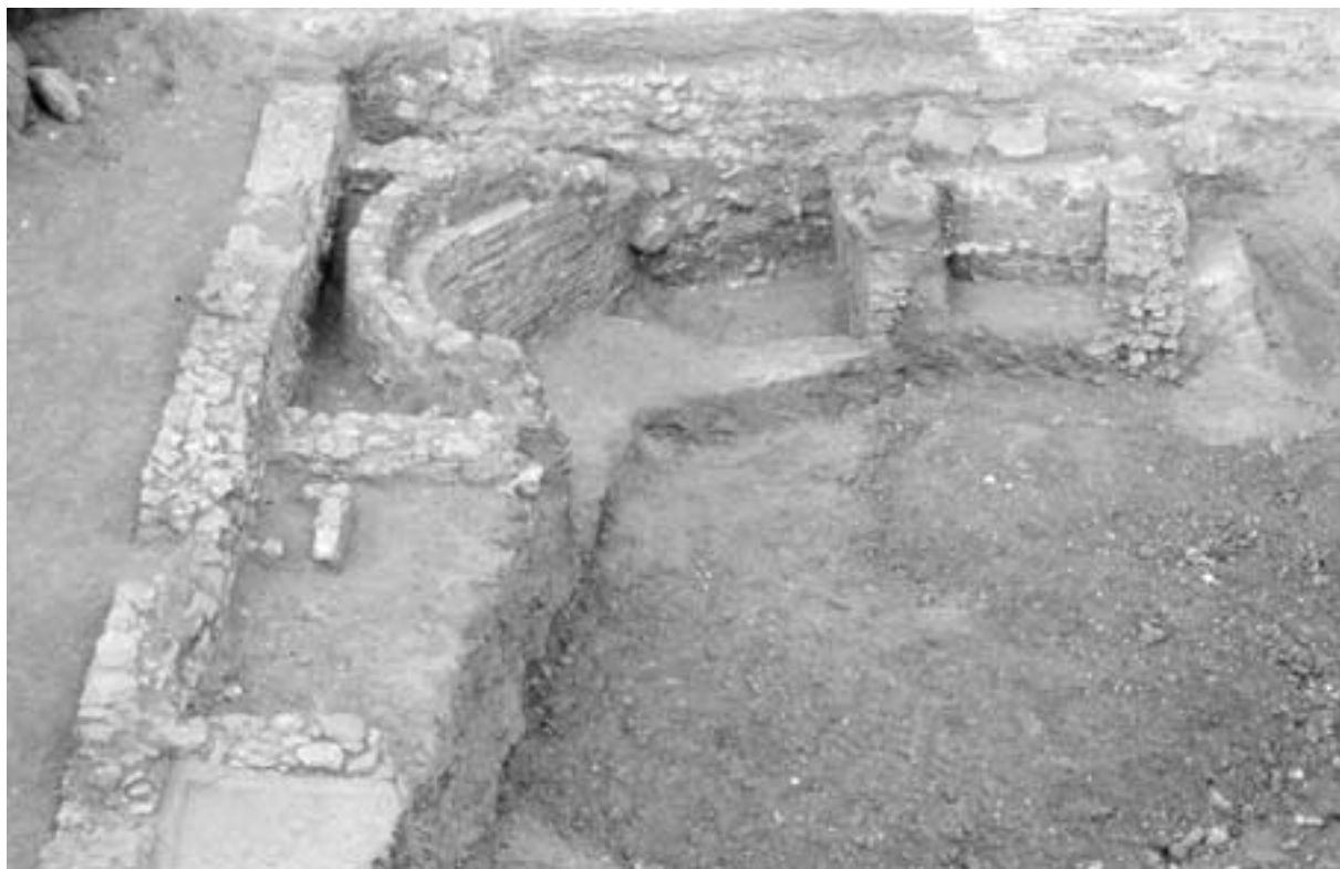
Fig. 2. Muro de cierre del yacimiento y panorámica del horno afectado.

tos contemporáneos y modernos, se alcanzaron inmediatamente niveles de época bizantina. En este corte, donde se llegó a agotar la secuencia arqueológica, llegando a niveles estériles constituidos por un potente estrato de pizarra, se localizó un tramo de muro de opus incertum con orientación Noroeste-Sureste.