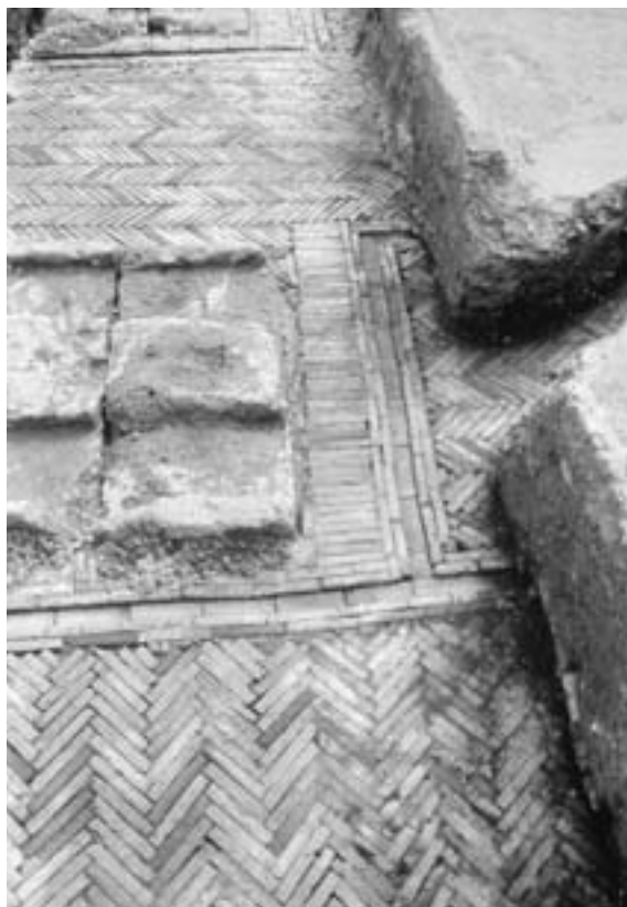
Fig. 1. Torcularium altoimperial amortizado por piletas de salazón de época tardorromana.

En el sector norte de la cuadrícula, y separada de la anterior por un tramo de muro de opus incertum (trabado con mortero de cal y arena), localizamos otra pileta, de mayores dimensiones y escasa profundidad; se presentaba fracturada y atravesada diagonalmente de suroeste a noreste por una canalización de hormigón proveniente de una servidumbre. La comunicación entre ambas piletas era posible a través