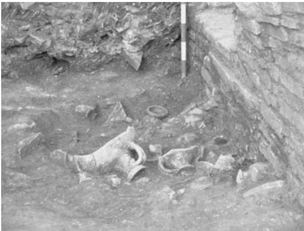
Fig. 3. Ánforas Beltrán 68 y Keay XXIII localizadas en el laboratorium .

Las cazuelas de imitación de cerámica de cocina africana constituyen un conjunto cuantitativamente importante. En estas imitaciones, en las que la seme-