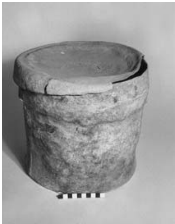
Fig. 2. Urna cineraria de plomo (Museo Nacional de Arte Romano, Mérida).

Este tipo de urnas podían funcionar de dos maneras: como recipiente que acoge directamente los restos, es decir, como urna propiamente dicha, o bien