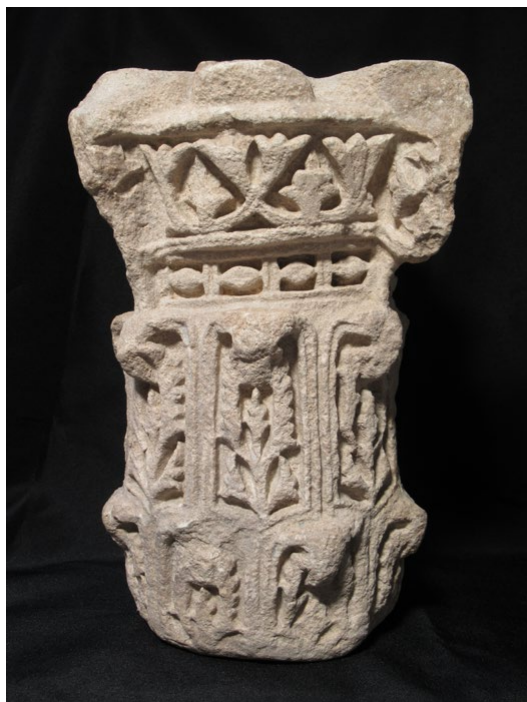
Fig. 14. Vista de la cara frontal del capitel, con la profusa decoración vegetal en relieve del equino, el astrágalo y las hojas de las dos coronas del cálato. (Museo de Huesca).