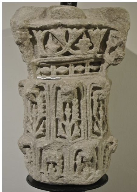
Fig. 13. Vista de la cara frontal del capitel, con referencia métrica. Obsérvese la profusa decoración en relieve del equino, el astrágalo y las dos coronas de hojas de acanto del cálato.