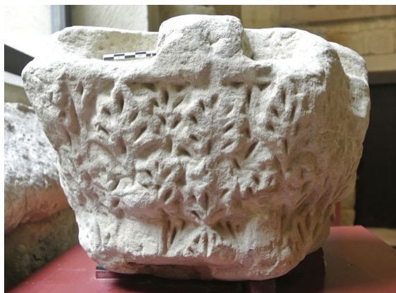
Fig. 6. Vista de la cara lateral izquierda del capitel. Obsérvese el ábaco con cartela plana, el equino con decoración de ataurique de palmetas notablemente erosionada y lo que queda del cálato, con pencas u hojas de acanto lisas, entre las que se conserva una palmeta incompleta en relieve terminada a bisel flanqueada por dos espacios triangulares con tres zonas de sombra en forma de gota de agua invertida. (Foto: José Ángel Asensio).