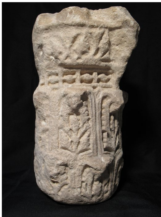
Fig. 15. Vista de la cara lateral izquierda del capitel, con notable erosión por disolución, apreciable sobre todo en el equino. (Museo de Huesca).