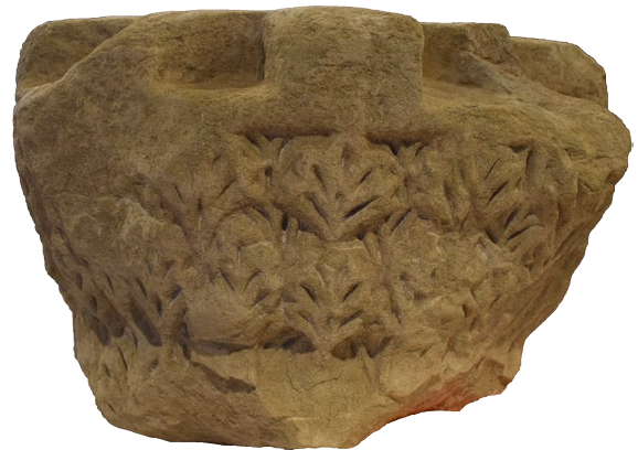
Fig. 5. Vista de la cara frontal del capitel. Obsérvese la cartela lisa del ábaco, la decoración de ataurique de palmetas del equino y lo que queda de las pencas u hojas de acanto del cálato, lisas y enmarcadas por listeles, en la parte conservada del mismo. (Museo Diocesano de Huesca).