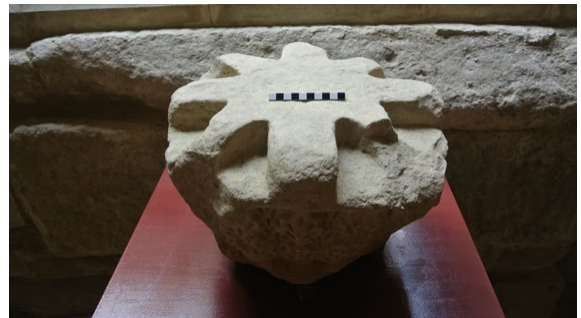
Fig. 3. Vista superior y frontal del capitel. Obsérvese la cruz de cartelas, en forma de estrella conformada por ocho brazos de sección cuadrangular.