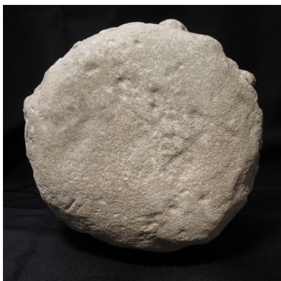
Fig. 20. Vista de la cara inferior lisa del capitel, que estaría en contacto con el sumoscapo del fuste. (Museo de Huesca)

En función de sus características formales, este capitel puede clasificarse como de orden compuesto dado que cuenta con ábaco, equino, volutas bajo las aristas, astrágalo y cálatos organizado en dos órdenes o coronas de hojas de acanto provistas en su interior de decoraciones en relieve, siguiendo un esquema compositivo muy similar al de numerosos ejemplares de época taifa plena de la Aljafería de Zaragoza (Marinetti, 1990: 152-155; Cabañero, 2020: figs. 128, 129, 139, 151-155 y 158-163).