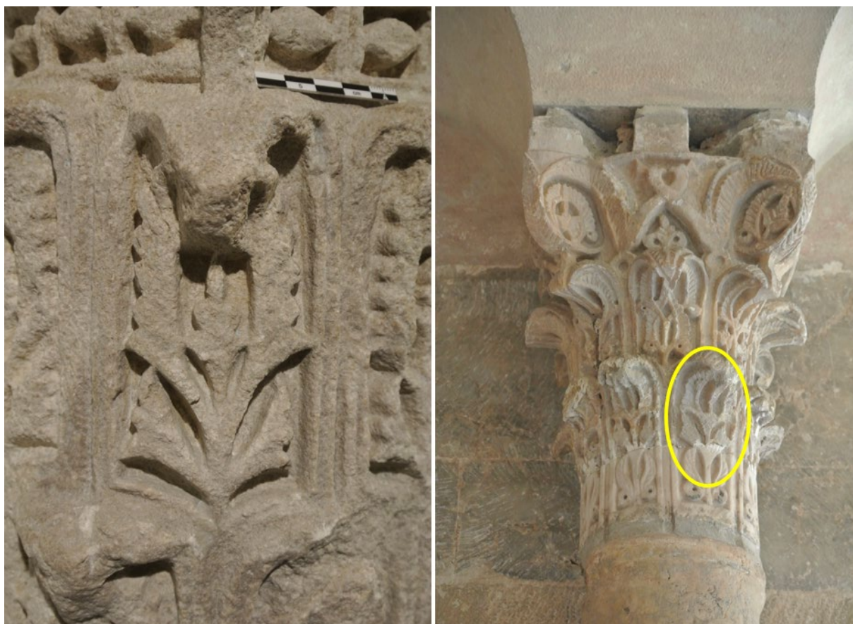
Fig. 21. Comparación entre el motivo decorativo de las hojas de acanto de la corona superior del cálato del capitel del Museo de Huesca, a la izquierda, y el de las hojas de la corona inferior de uno de los capiteles del pórtico norte de la Aljafería (Cabañero, 2020: n.º 19), a la derecha.

se dispusieron otras tantas volutas, de las que debido a su fragilidad tan solo se conservan incompletas dos (figs. 13-18). Estas volutas estarían en su extremo inferior posiblemente unidas al vértice de las hojas de acanto de la corona superior, formando las denominadas asas , como ocurre en otro capitel compuesto de alabastro conservado en el Museo del Teatro Romano de Zaragoza (Lasa, 1991), 33 aunque en nuestro caso nada se conserva de las mismas.