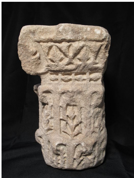
Fig. 16. Vista de la cara lateral derecha del capitel, con notable desgaste debido a la erosión hídrica. (Museo de Huesca).