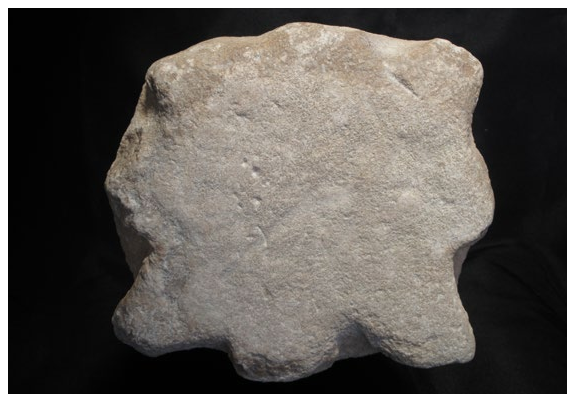
Fig. 11. Cara superior lisa del ábaco del capitel compuesto del Museo de Huesca. Su cara frontal aparece en la parte inferior de la imagen. Obsérvese la estrella del ábaco sin desarrollo en altura y las marcas esgrafiadas en la parte central izquierda. (Museo de Huesca).

menores y un acusado grado de meteorización y erosión por disolución hídrica, que resulta más intenso en dos de sus cuatro caras (figs. 12-19). Este desgaste, típico de los elementos constructivos fabricados con este tipo de piedra y sometidos a la acción prolongada de los agentes erosivos (Cantos y Criado, 2011: 260), permite suponer que esta pieza pudo coronar una columna emplazada en el exterior del edificio del que formaba parte.