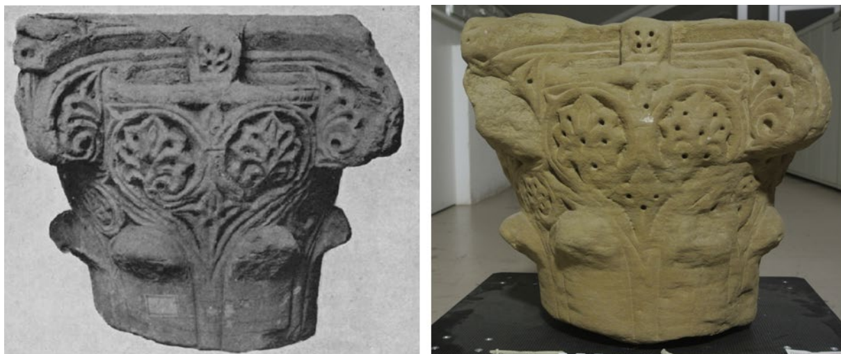
Fig. 9. Capitel andalusí de arenisca procedente, al parecer, de la iglesia de San Juan de Jerusalén de Huesca, conservado en el Museo de Huesca. En la imagen de la izquierda, correspondiente a la fotografía publicada por Gómez Moreno (1945: lám. xxiii a), se puede apreciar la decoración en buen estado, con palmetas de siete digitaciones apuntadas que dan idea de cómo pudieron ser las del equino del capitel del Museo Diocesano de Huesca. La imagen de la derecha, tomada en febrero de 2024 en los fondos del Museo de Huesca, refleja su estado actual.

0,39 metros en cada una de sus cuatro caras, asimilable a 1 palmipié islámico de 0,3928 metros (Jiménez, 2015: 4). 15 Para intentar reconstruir su altura original, dado su carácter fragmentario, debemos basarnos en paralelos bien conservados de la Marca Superior con amplitudes similares en el ábaco, como el citado capitel de arenisca del Museo de Huesca o uno de los de la aljama de Tudela, cuyos alzados rondan o superan ligeramente los 0,40 metros. 16 Por ello, parece razonable proponer para este ejemplar oscense del Museo Diocesano de Huesca una altura total de ca. 0,40-0,47 metros, de manera que su diseño habría tendido hacia un módulo de tendencia cúbica de tradición califal (Domínguez, 1983: 128-133, fig. 2, gráf. 3) todavía alejado del canon estilizado que se impone en los capiteles de la Marca Superior a partir de mediados del siglo xi (Domínguez, 1985: 73-74). 17