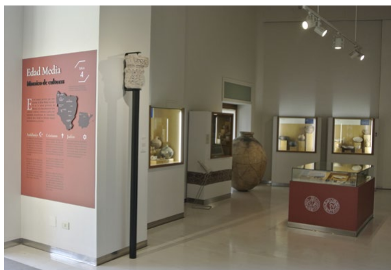
Fig. 10. Capitel corintizante de alabastro de Casa Lafarga de Huesca, en el contexto de la exposición permanente (sala 4: Alta Edad Media) del Museo de Huesca. (Foto: José Ángel Asensio).

El capitel, labrado en alabastro blanco, se conserva casi íntegro, aunque presenta algunas fracturas