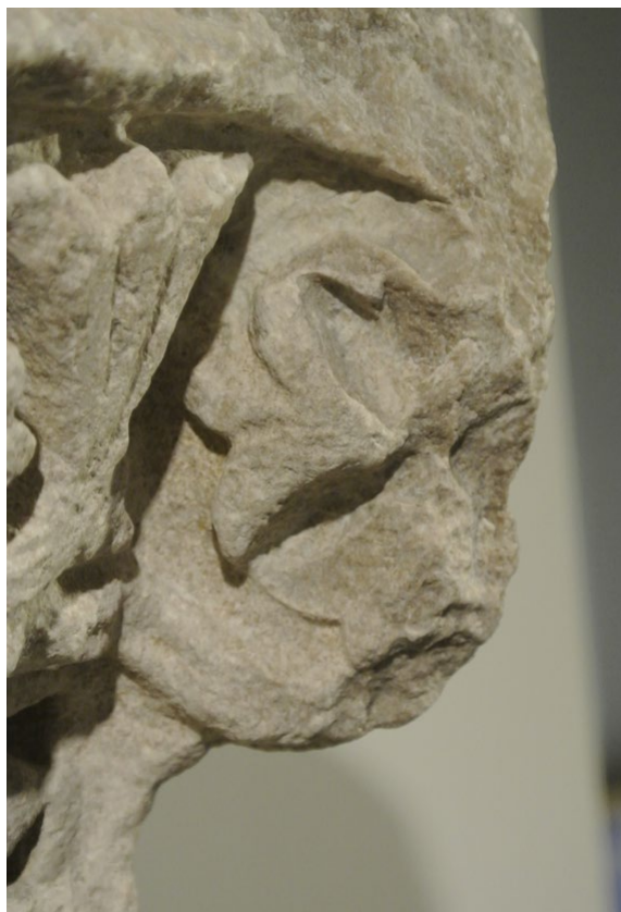
Fig. 22. Detalle del motivo vegetal de la decoración de las caras laterales de las volutas del capitel, en concreto en la cara izquierda de la voluta derecha de la cara frontal de la pieza.

citados, reutilizados en la torre campanario de la iglesia de la Magdalena de Zaragoza (Cabañero, 2002). 36