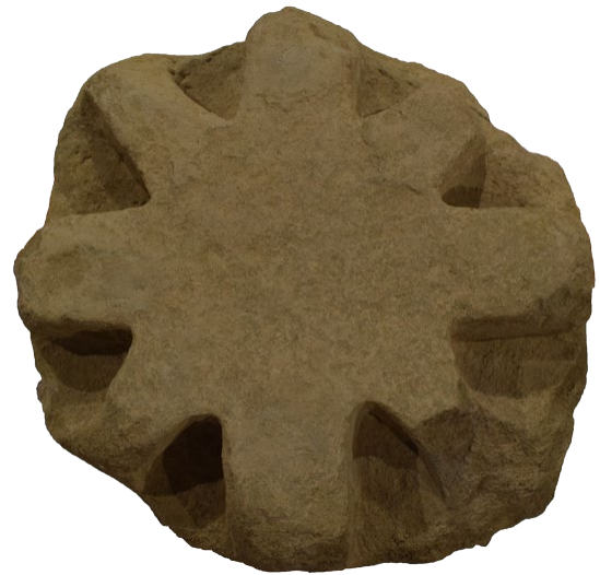
Fig. 2. Vista superior del capitel, en la que se aprecia el ábaco con estructura de estrella, perfectamente desarrollada en alzado. (Museo Diocesano de Huesca).