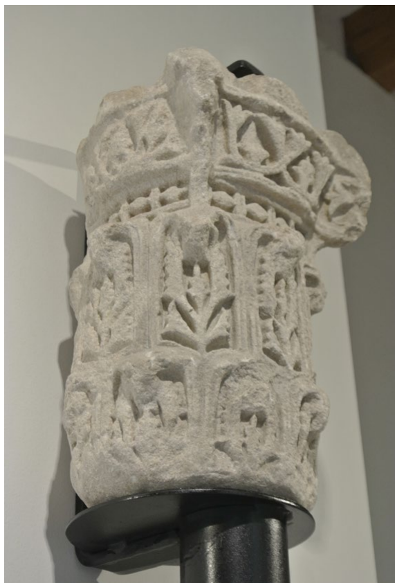
Fig. 18. Vista de las caras frontal (a la derecha) y lateral izquierda (a la izquierda) del capitel, con la voluta en el centro de la parte superior.