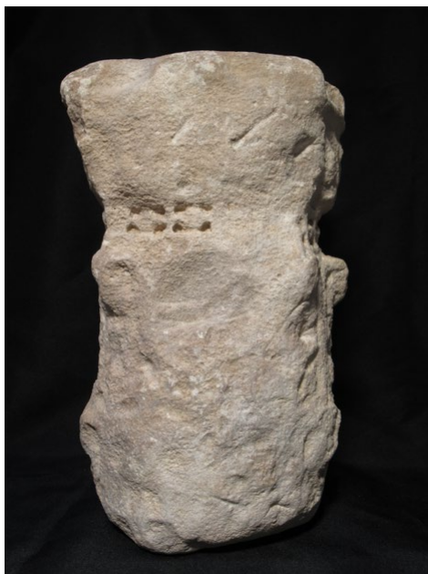
Fig. 12. Vista de la cara posterior del capitel, que se dejó sin terminar, alisada y apenas con perforaciones a trépano destinadas a facilitar la talla de los carretes del astrágalo, lo que demuestra que no era visible. (Museo de Huesca).