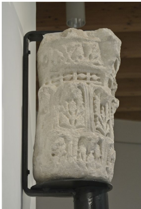
Fig. 19. Vista de la cara lateral izquierda del capitel, con perforación realizada a trépano en una de las hojas de acanto de la parte izquierda de la corona inferior.