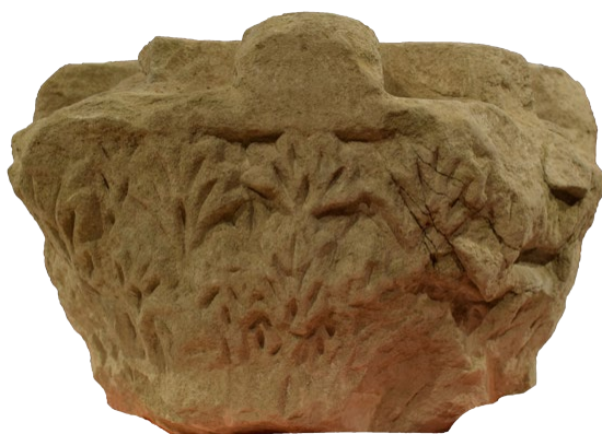
Fig. 7. Vista de la cara lateral derecha del capitel. Obsérvese el ábaco con cartela plana, el equino con decoración de ataurique de palmetas y lo que queda del cálato, con pencas u hojas de acanto lisas. (Museo Diocesano de Huesca).

Por lo que se conserva, resulta evidente que este capitel carecía de volutas, astrágalo, caulículos y cálices bien diferenciados, 14 elementos propios de los órdenes corintio y compuesto, por lo que podemos identificarlo como de tipo corintizante, del que se conocen numerosos paralelos de época taifa en la Marca Superior procedentes de la mezquita mayor de Zaragoza (Hernández et alii , 1997: fig. 21; Hernández