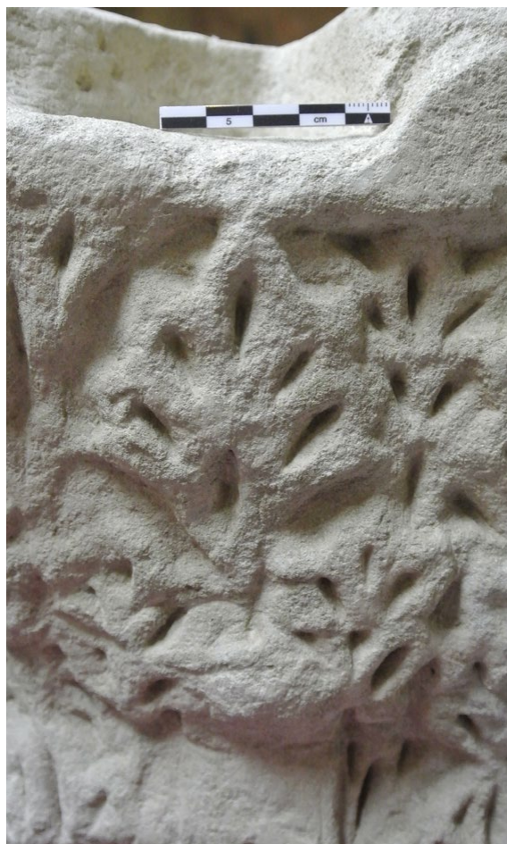
Fig. 8. Detalle de la decoración vegetal en relieve de palmetas digitadas con profundas zonas de sombra en forma de gota en la cara lateral izquierda del capitel. Obsérvese en la parte superior izquierda de la imagen, justo a la izquierda de la palmeta digitada, el elemento en forma de ye que podría ser un recuerdo de los caulículos y los cálices del orden corintio inspirado en los modelos califales, así como, en la parte inferior, una de las hojas de acanto lisas de lo que queda del cálato.

et alii , 1998: 76; Hernández, 2004: foto 4); de la torre de la iglesia de la Magdalena, del convento de Santo Domingo y de la sala capitular del monasterio del Santo Sepulcro de Zaragoza (Cabañero, 2002); de la mezquita mayor de Tudela (Gómez Moreno, 1945: láms. II-IV; Uranga e Íñiguez, 1971: 105, lám. 28; Pavón, 1978: 27-28, láms. IX-XI; Esco et alii , 1988: 40-41; Lacarra, 1998: 82-83; Cabañero y Lasa, 2002: 716-720), y de las aljamas de Barbastro (López, 2013: 78-79) o Lérida (Riu, 1998: 223).