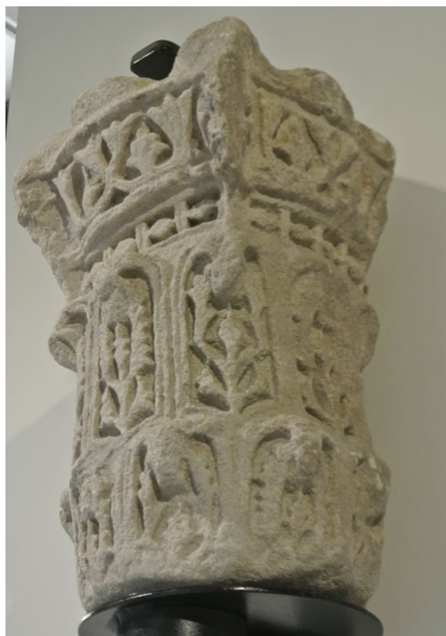
Fig. 17. Vista de las caras frontal (a la izquierda) y lateral derecha (a la derecha) del capitel, con la voluta en el centro de la parte superior. (Foto: José Ángel Asensio).