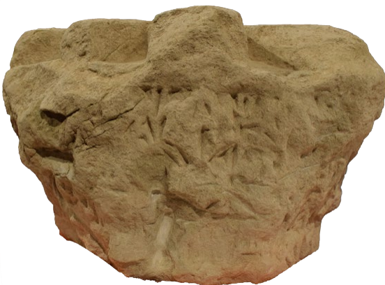
Fig. 4. Vista de la cara trasera del capitel, con la decoración de palmetas apenas esbozada debido a que no iba a ser visible, lo cual se aprecia en especial en la palmeta central del orden superior del equino, en el centro de la imagen. (Museo Diocesano de Huesca).