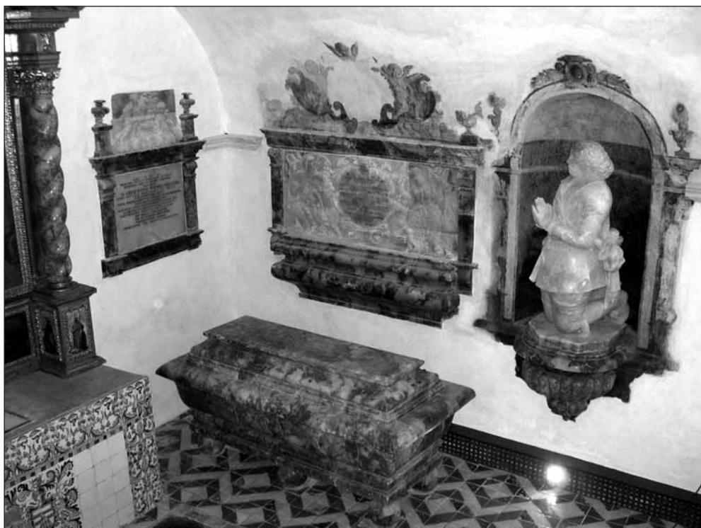
Detalle de la cripta de los Lastanosa en la catedral de Huesca: sarcófago y escultura de Vincencio Juan de Lastanosa y enterramiento parietal de su mujer, Catalina Gastón. Estado actual tras su restauración.

mías y dorados, ha sido el máximo objetivo al que iban dirigidos todos los tratamientos desarrollados en la restauración de las decoraciones murales y bienes muebles.