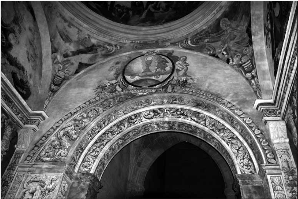
Arco de entrada a la capilla de los Lastanosa, visto desde el interior de la misma, con pintura mural de tema eucarístico. Estado actual tras la restauración.

Poco a poco, las intervenciones realizadas al margen del ideario de concepción constructiva, social e iconográfica de la capilla, las mutilaciones del espacio, las transformaciones de la luz y la paulatina pérdida de entidad y utilidad del espacio con el consiguiente abandono de las tareas de mantenimiento, desembocaron en la constata-