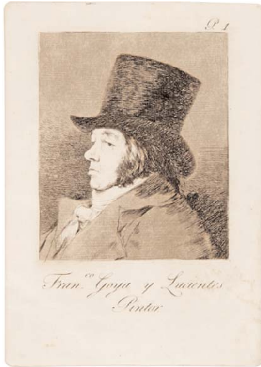
Caprichos de Goya. Madrid, Fundación Lázaro Galdiano.