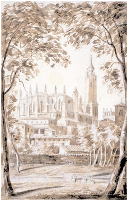
Huesca. Catedral. Vista exterior desde la Alameda. Madrid, Fundación Lázaro Galdiano.

— Casa de los Artales. Fachada. N.º inventario 9600.