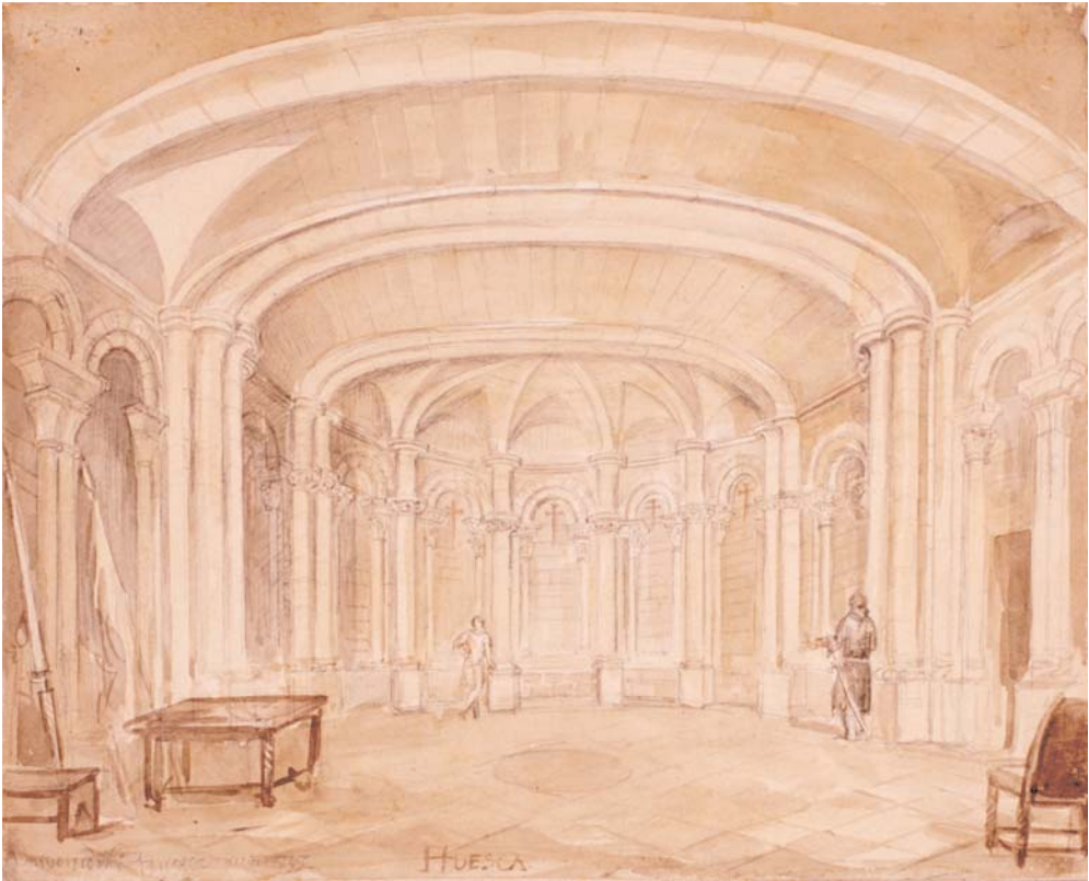
Huesca. Palacio de los Reyes de Aragón. Sala de Doña Petronila. Madrid, Fundación Lázaro Galdiano.