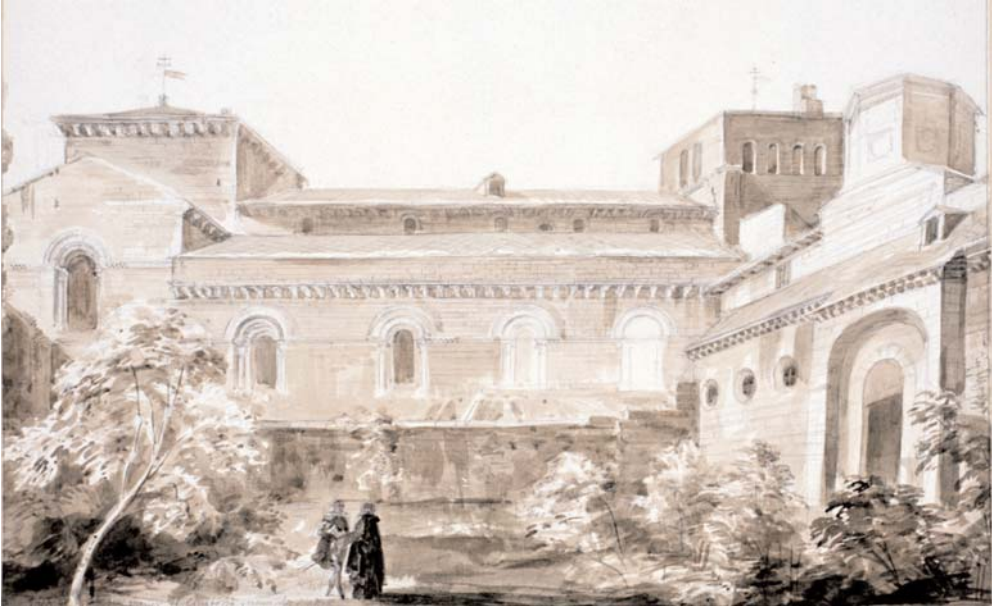
Jaca. Catedral de San Pedro. Vista exterior.