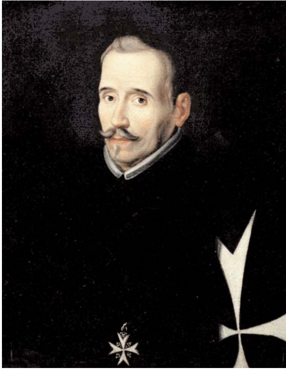
Lope de Vega. Madrid, Fundación Lázaro Galdiano.