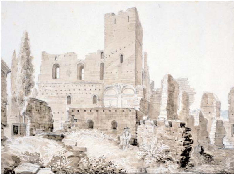
Monasterio y castillo de Montearagón. Vista exterior en ruinas. Madrid, Fundación Lázaro Galdiano.