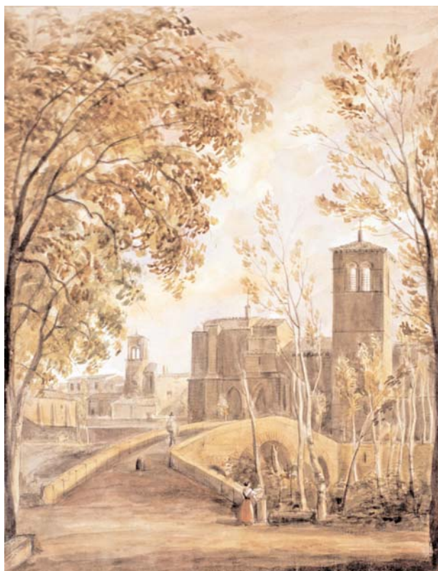
Huesca. Convento de San Miguel. Vista exterior. Madrid, Fundación Lázaro Galdiano.