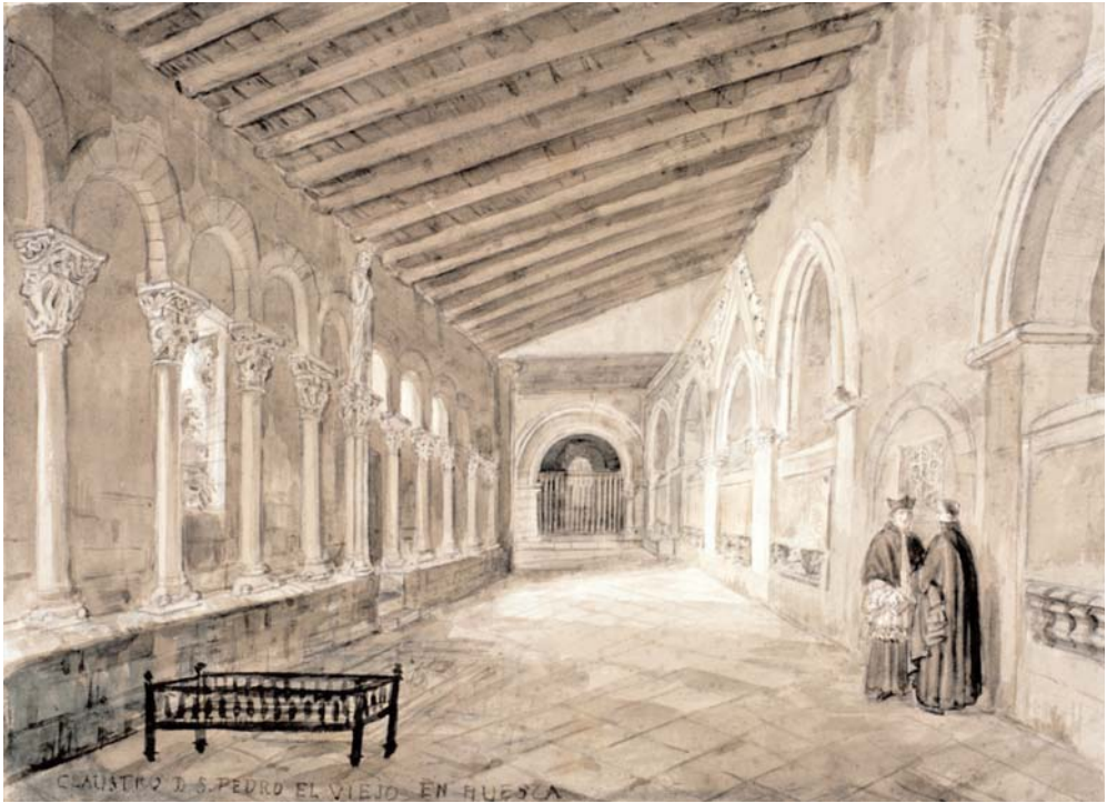
Huesca. Iglesia de San Pedro el Viejo. Claustro. Madrid, Fundación Lázaro Galdiano.