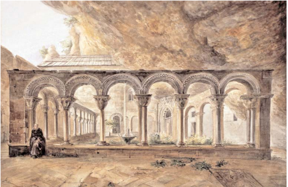
Monasterio de San Juan de la Peña. Claustro. Madrid, Fundación Lázaro Galdiano.