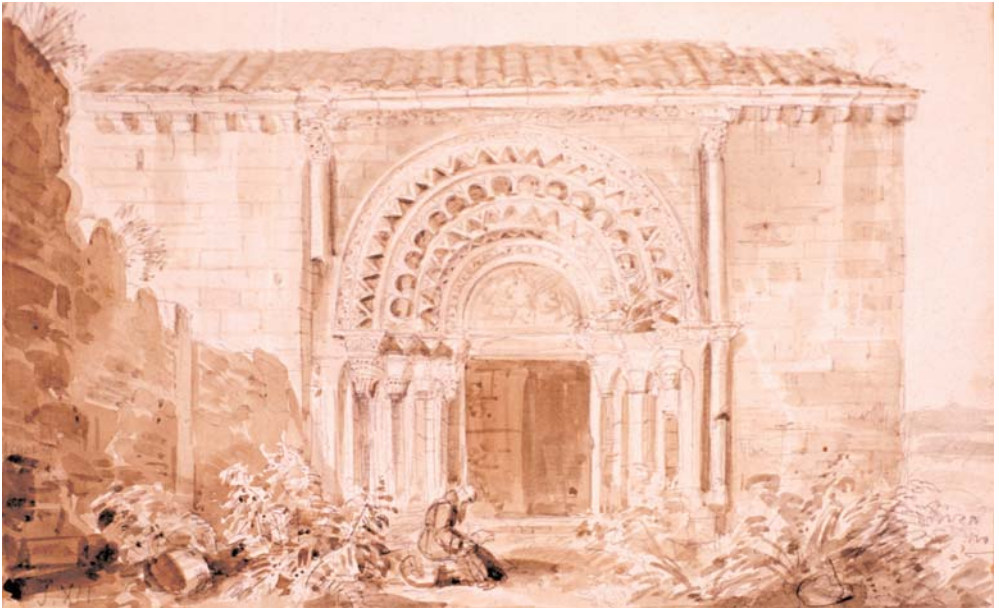
Anzano. Iglesia. Vista exterior. Madrid, Fundación Lázaro Galdiano.

— Iglesia. Vista exterior. N.º inventario 9209.