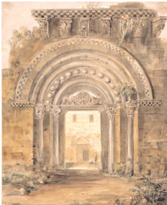
Santa Cruz de la Serós. Monasterio de Santa María. Madrid, Fundación Lázaro Galdiano.