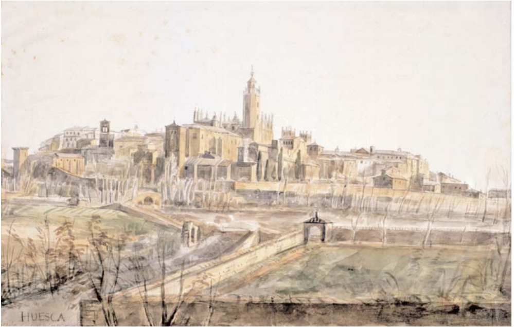
Huesca. Vista de la ciudad desde los Capuchinos. Madrid, Fundación Lázaro Galdiano.