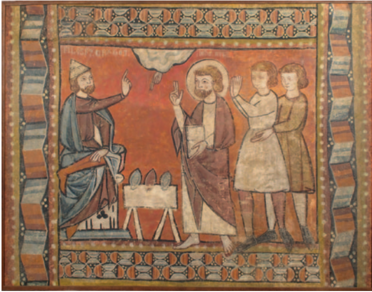
Miracle of the Jewels. Master of Bierge . (Metropolitan Museum of Art. The Cloisters Collection)