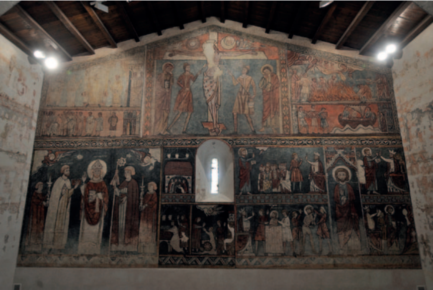
Aspecto actual del sector del testero. (Foto: Pablo Otín, octubre de 2023)