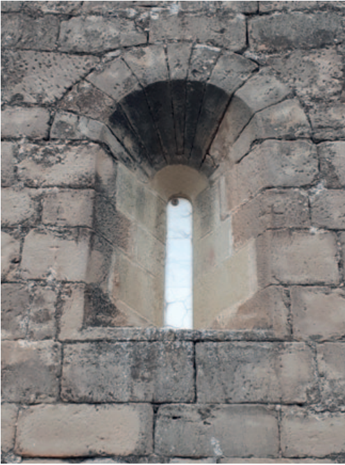
Vista actual de la ventana abocinada del testero desde el exterior.