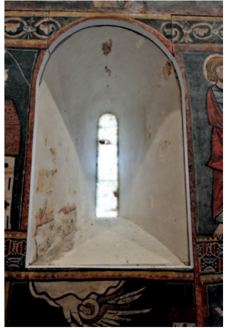
Vista actual de la ventana abocinada del testero desde el interior. (Foto: Pablo Otín, octubre de 2023)

ya había sido sometida por los hermanos Gudiol a la drástica intervención que los llevó a estar hoy en día unidos en un solo bastidor. 25 Esas dos imágenes, tituladas Lucha de caballeros , 26 son casi iguales: una de ellas está datada en 1952 —es decir, dos años más tarde que el resto de la serie— y la otra presenta la anotación “duplicada”. Solo una de ellas aclara su localización: “Huesca, Museo Diocesano”. De cualquier forma, en ambas podemos observar que en esa fecha (1952) estaba ya realizada la reunificación —seguramente bajo el dictado de los Gudiol— de los dos fragmentos en un mismo soporte, tal y como se presenta en la actualidad, y por tanto podemos concluir que la