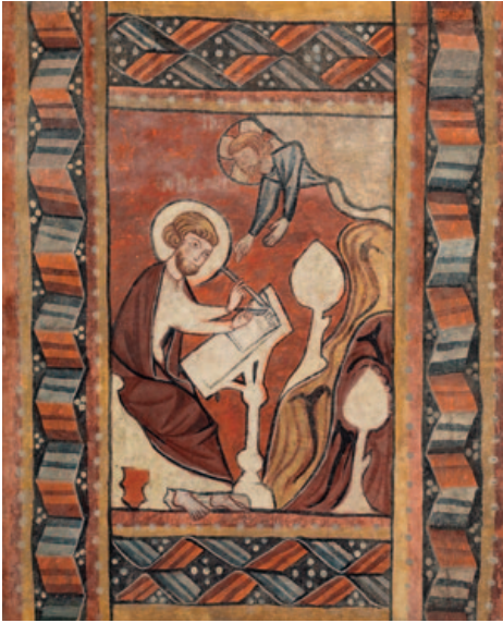
Saint John on Patmos. Master of Barluenga (sic). Fresco transferido a lienzo. (Joslyn Art Museum)