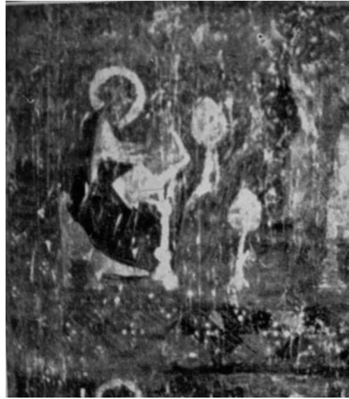
Primera escena de la historia de san Juan Evangelista: san Juan en Patmos. Frescos originales situados en el muro sur (lado de la epístola) de la ermita de San Fructuoso de Bierge.