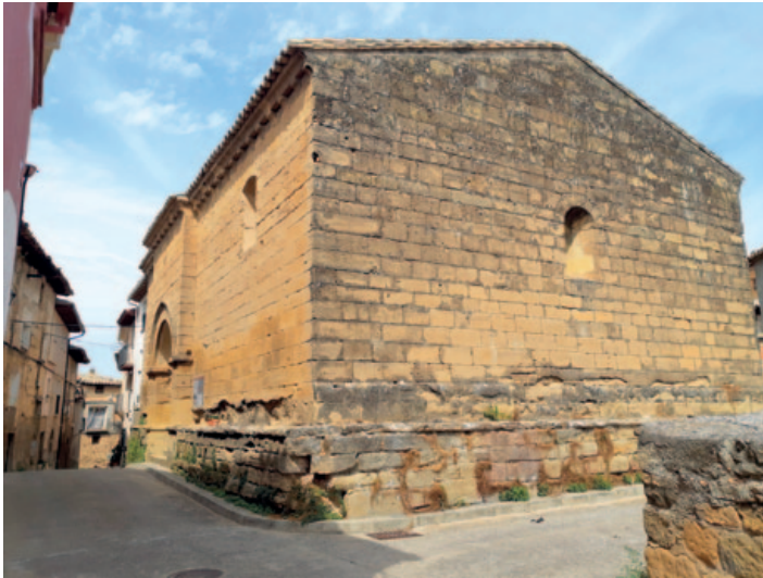
San Fructuoso de Bierge. Arriba, portada de entrada al recinto, orientada al sur. Abajo, vista del testero, con la ventana abierta en el muro este.