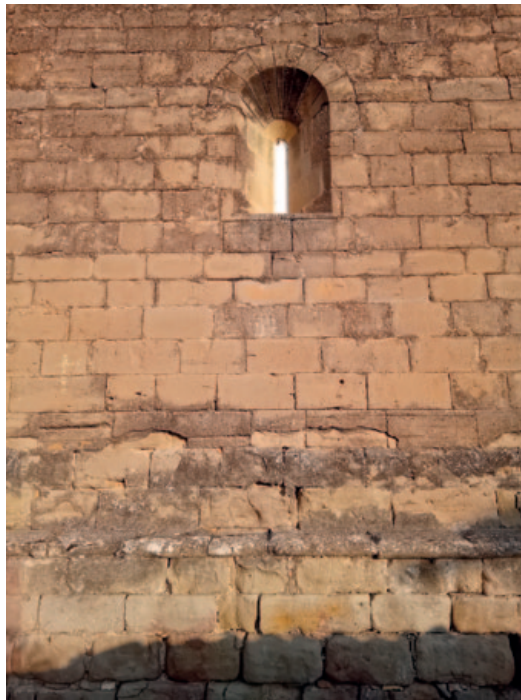
Efecto de asoleo en el exterior del testero de San Fructuoso a las ocho de la mañana del 21 de junio de 2025.

Para esclarecer algunas de estas cuestiones, ¿no merecería la pena realizar una sencilla prueba empírica, siempre, por supuesto, recurriendo al apoyo y a la asistencia