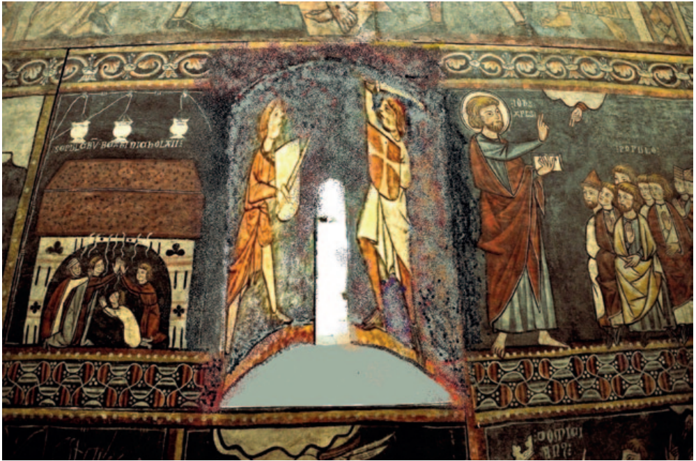
Reconstrucción hipotética de la ubicación de los fragmentos en su espacio original en la ventana del testero. (Elaboración propia)

En efecto, la interpretación actual, fuertemente mediatizada por una plasmación icónica que unifica los dos fragmentos originales en un solo plano de representación y olvida su verdadera contextualización dentro de la ventana del testero, priva a la combinación resultante de ser apreciada con la carga simbólica que en origen le pertenece, dentro de los códigos estéticos medievales, en los que las implicaciones simbólicas de la luz adquieren una importancia fundamental. Según una nueva hipótesis más ajustada a las características de la obra en su concepción original y su contexto específico, los jóvenes guerreros representados no lucharían entre sí, sino que acompañarían de manera rítmica la filtración de la luz a su paso entre ellos, en lo que originalmente se conformaba como la fuente esencial de iluminación del oscuro espacio sagrado de tradición románica. 55