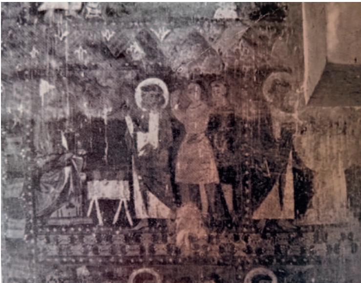
Pasaje de la historia de san Juan Evangelista. Frescos originales situados en el muro sur (lado de la epístola) de la ermita de San Fructuoso de Bierge.