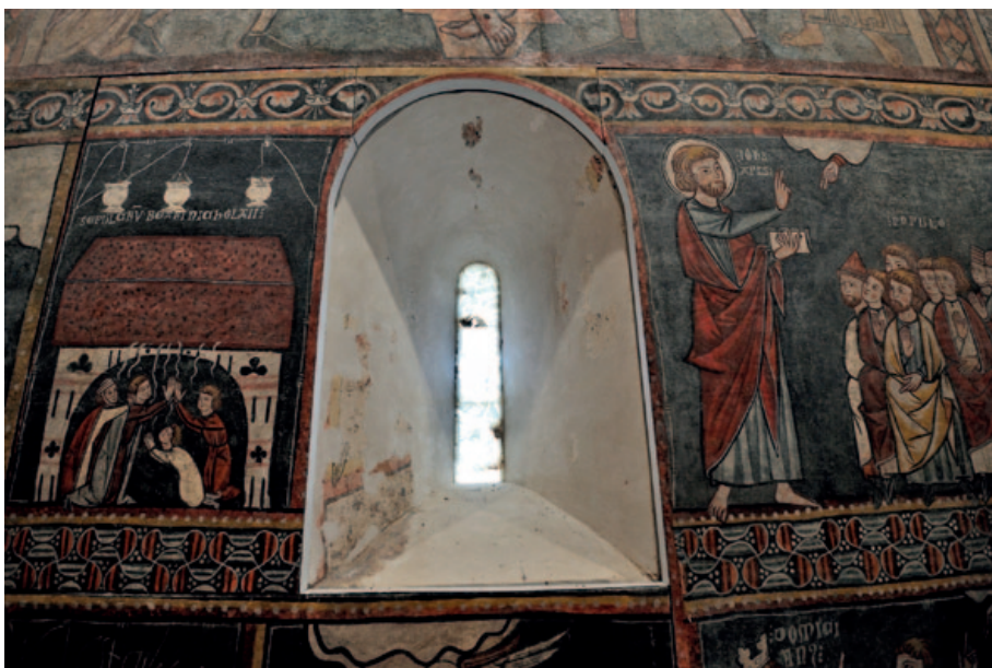
Sector central del testero en su estado actual. (Foto: Pablo Otín, octubre de 2023)