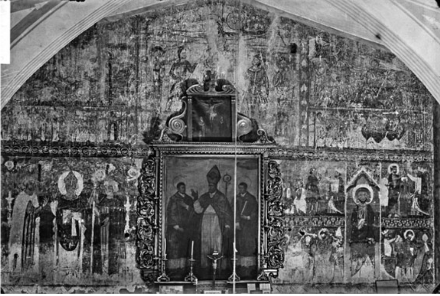
El retablo que ocultaba la ventana del testero.