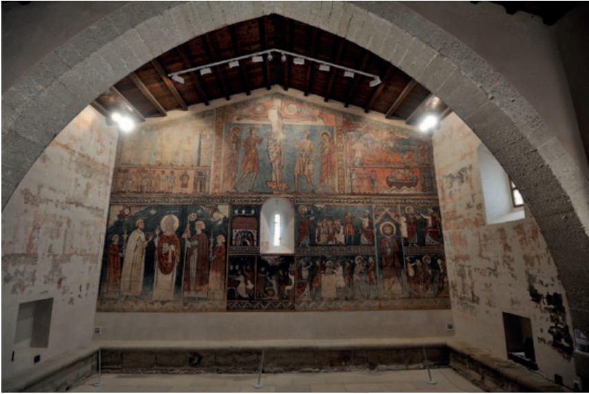
Vista general del presbiterio de San Fructuoso. (Foto: Pablo Otín, octubre de 2023)

del suelo del interior de la ermita, pero no se puede descartar que haya algunos más, pues se tiene constancia de que, según algunos vecinos que viven en sus alrededores, existirían varios enterramientos que nunca han sido objeto de excavación. 15 Las conclusiones de esa campaña arqueológica en concreto hablan de un individuo de talla mediana y sexo femenino. 16