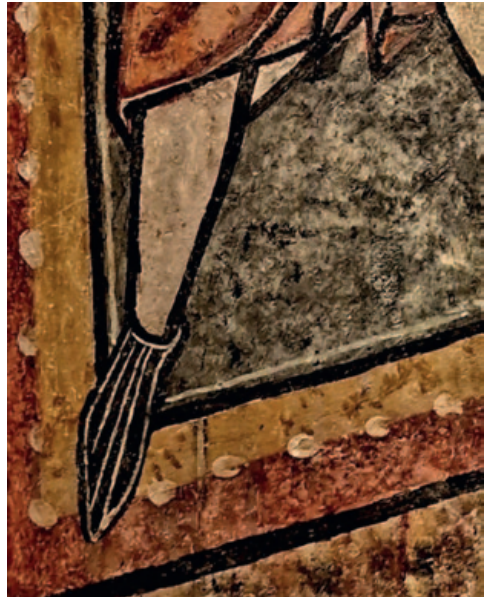
La misma zona en la obra Entrenamiento de un hospitalario con su escudero. (Museu de Montserrat)