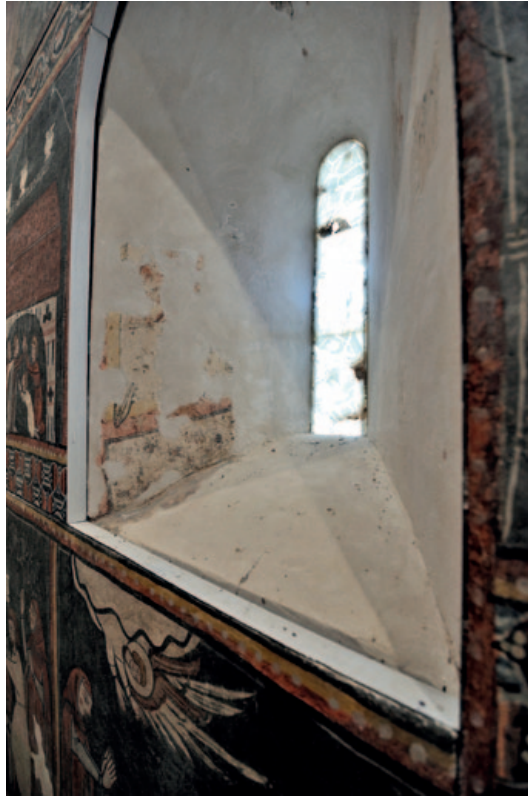
Ventana del testero con improntas de la pintura original. (Foto: Pablo Otín, octubre de 2023)

múltiples soportes, algunos en elementos litúrgicos obligatorios en esa época en todo recinto de culto como eran los frontales de altar o en las indumentarias realizadas con la técnica de bordado opus anglicanum , que en ese momento eran muy demandadas por su excelente calidad, además de, por supuesto, como elocuentes protagonistas de las propuestas ornamentales de los muros.