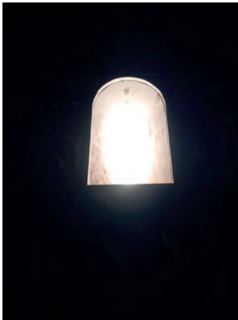
Efecto de asoleo en el interior de San Fructuoso a las ocho y diez de la mañana del 21 de junio de 2025.