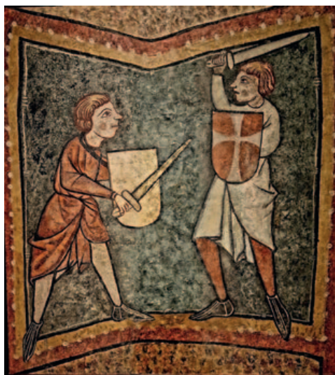
Entrenamiento de un hospitalario con su escudero. Fragmento de pintura mural procedente de San Fructuoso de Bierge. Ca. 1280-1300. Fresco transportado a un soporte móvil. (Museu de Montserrat)