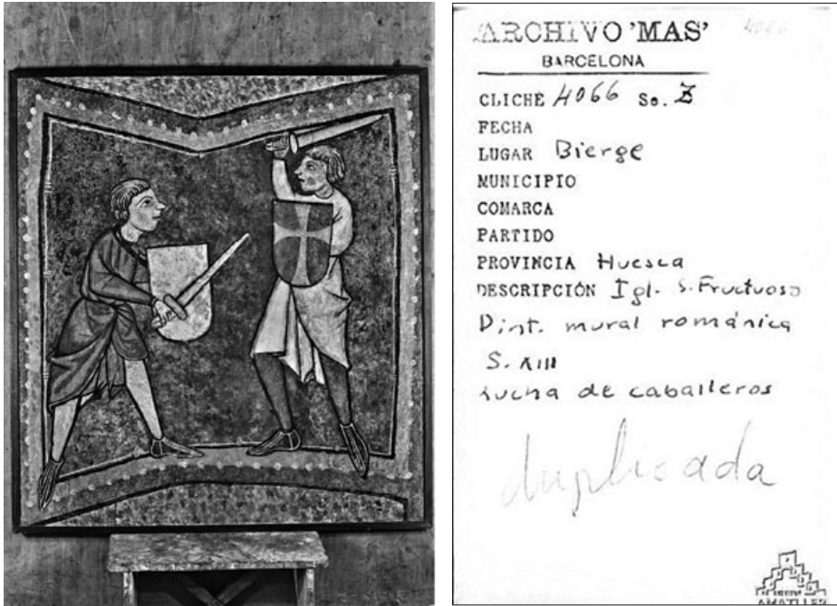
Lucha de caballeros. Anverso y reverso de la fotografía en la que se escribió la anotación “duplicada”.

restauración efectuada en 2013 —que más adelante se expondrá con más detalle— supuso en realidad una segunda intervención.