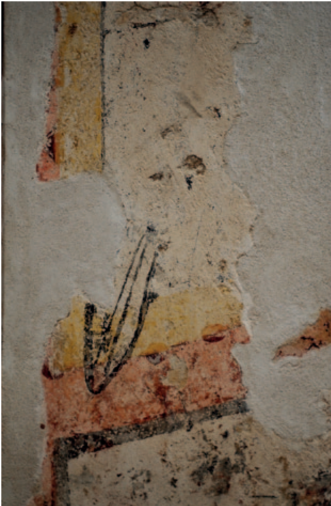
Impronta del caballero de la parte izquierda de la ventana en su estado actual in situ. (Foto: Pablo Otín, octubre de 2023)

documentación y entrevistó a las personas más longevas del pueblo, que o simplemente no recordaban el fragmento o situaban la escena en lugares diversos del templo, especialmente en la parte superior de la pila de agua bendita, que se encuentra en el lado izquierdo de la puerta, pero la memoria es frágil y esa ubicación no coincidía con las medidas de la obra que actualmente pertenece al museo catalán. Por nuestra parte, tomamos medidas de otra zona, en principio apropiada para la decoración con pinturas: el intradós del arco apuntado correspondiente al acceso al presbiterio del templo. Nuevamente las dimensiones no se correspondían, esta vez por déficit, con las del fragmento mural. Por fin, tras varios meses sin alternativa, y habiendo llegado a la conclusión de que la obra en realidad no procedía de allí, la asistencia a un concierto celebrado en el recinto propició la observación atenta y la toma de medidas del único lugar sin pinturas de toda la cabecera: su único vano. En efecto, una aproximación a la