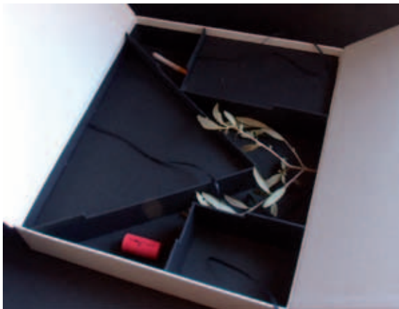
Elementos significativos incluidos en el interior del libro objeto diseñado.