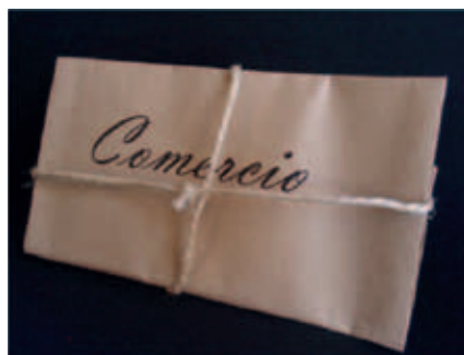
Documentos reales guardados por Ángel Sanagustín y adaptación al libro objeto.