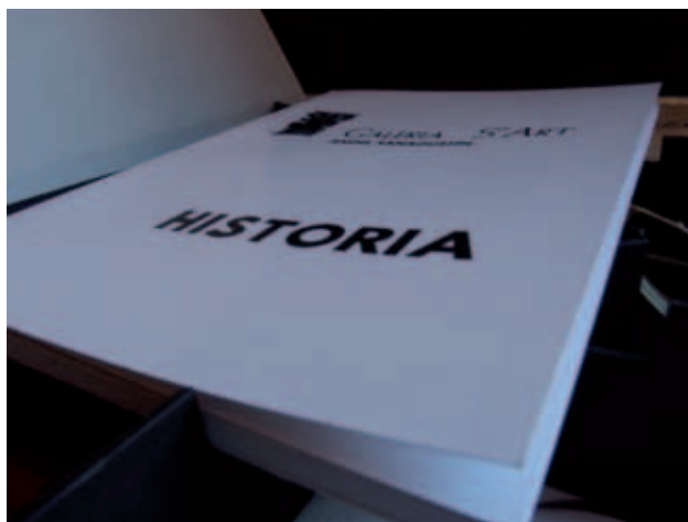
Libro recopilatorio de la dimensión galería de arte S'Art.