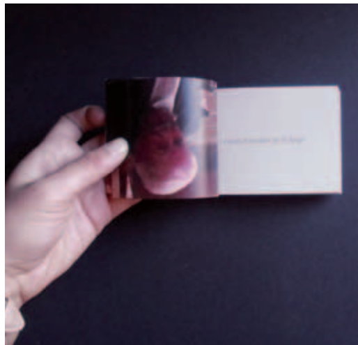
Libro recopilatorio de la dimensión biografía.