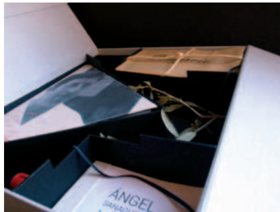
Distintas imágenes del libro objeto diseñado.