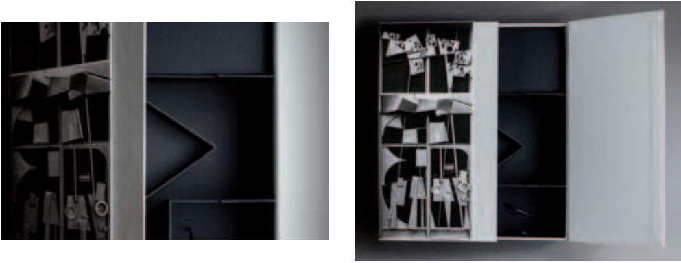
Interior vacío del libro objeto diseñado.