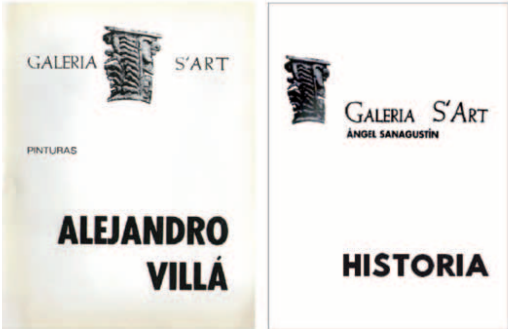
Folleto de una exposición realizada en la galería S'Art y portada diseñada para el libro objeto.

Copiando el tipo de papel, la tipografía utilizada, la disposición de los elementos dentro del folleto, los colores y el tamaño, tal y como se observa en las imágenes que reproducimos en esta misma página y en la siguiente.