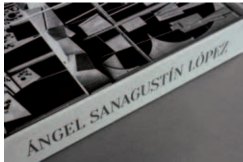
Vista exterior del libro objeto diseñado.