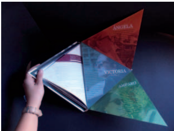
Portada e interior de la dimensión humana.