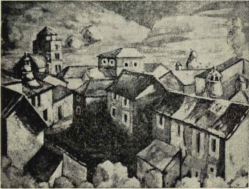
«Pueblo», óleo de Manuel Martín Guerrero.

terminar, el de un general. El dibujo, vigoroso, está definido, hecho. Bodegones, algunos con colores exaltados, fogosos; otros, delicados, sutiles. Rosas y azules.