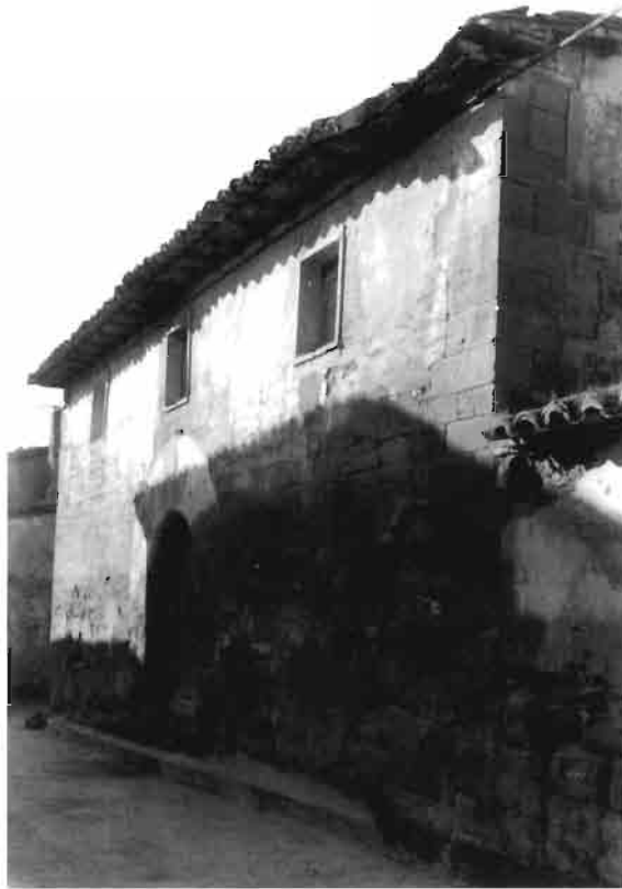
Fot. 1. Fachada principal del edificio del hospital de pobres de Ayerbe a finales de la década de los 80. Todavía puede apreciarse la existencia del alero original, que ya comenzaba a degradarse..