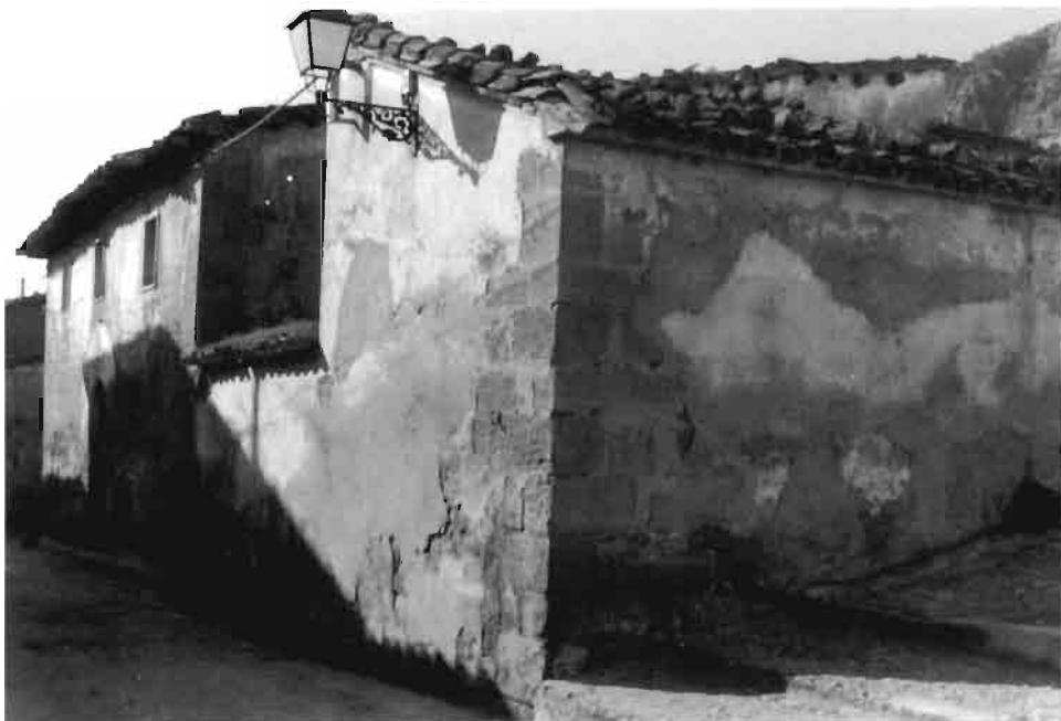
Fot. 2. Vista del inmueble adosado al hospital de pobres de Ayerbe en su lado o cara norte.

Hacia el mediodía da otra fachada con dos partes bien diferenciadas, que demuestran que en una etapa posterior a la de la construcción se hicieron obras de engrandecimiento del hospital, siguiendo tal vez el proyecto original que quedaría inacabado por falta de recursos económicos para continuar las obras: la parte inferior de toda la fachada está constituida por el zócalo de piedra sillar que, como ya se ha dicho anteriormente, rodea todo el hospital. En él hay situada una ventana, protegida con sencilla reja de barras de hierro, cuyo dintel es de una sola pieza de piedra. En lo que podríamos denominar "parte más antigua", el espacio comprendido entre donde finaliza el zócalo hasta el tejado se rellenó con tapial, exceptuándose las cadenas, que son de piedra, y de éstas, la posterior se levantó a más altura que la delantera para así cubrir el edificio echando la vertiente del tejado hacia el este. En esta zona superior existe una pequeña ventana. La otra zona, que podríamos calificar de "más tardía", es toda ella completamente de tapial y en altura es inferior al resto de la fachada. En