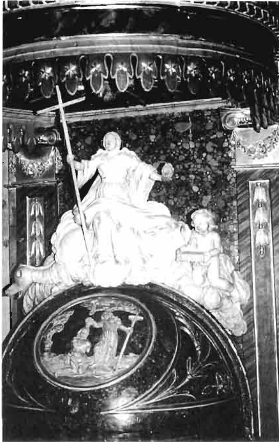
Detalle de la imagen situada sobre la cobertura de la pila.