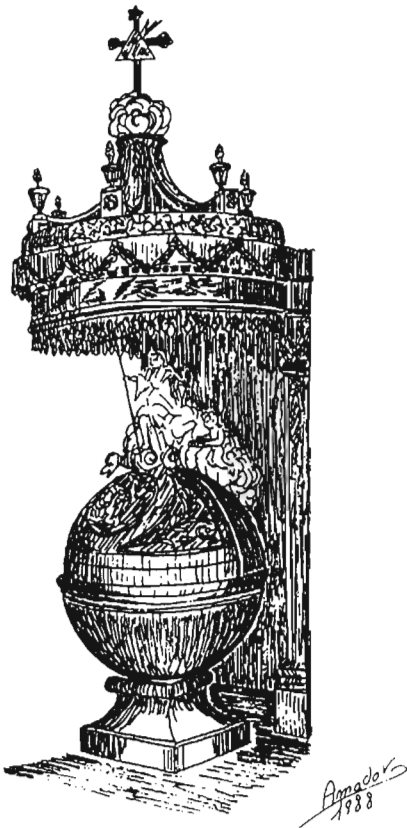
Dibujo artístico de la pila.