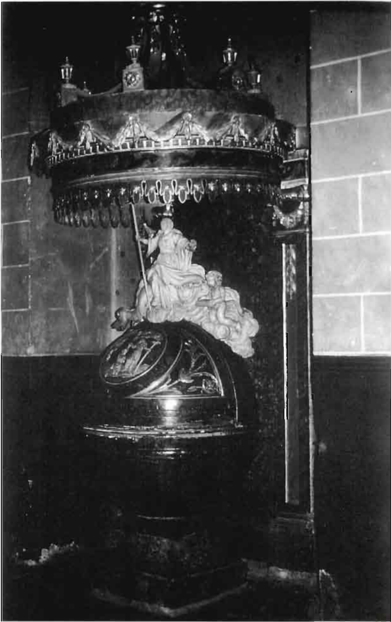
Conjunto escultural de la pila bautismal.