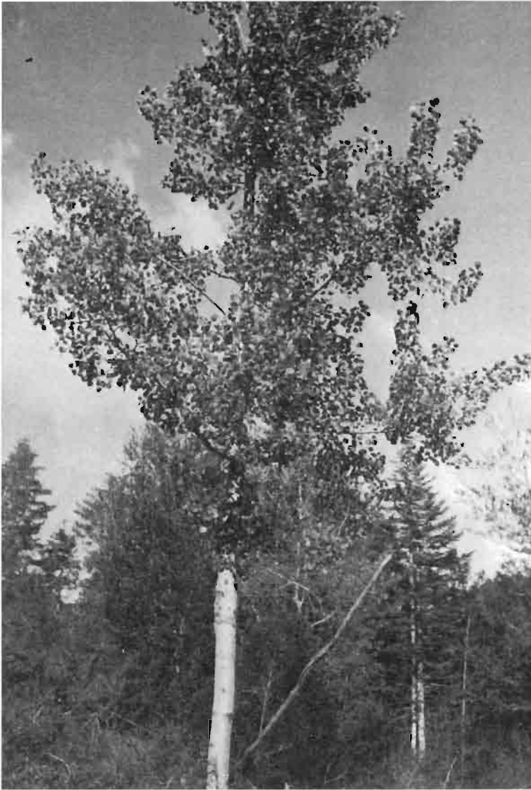
Monte de Plan. Abedul debajo del Plano de la Virgen.