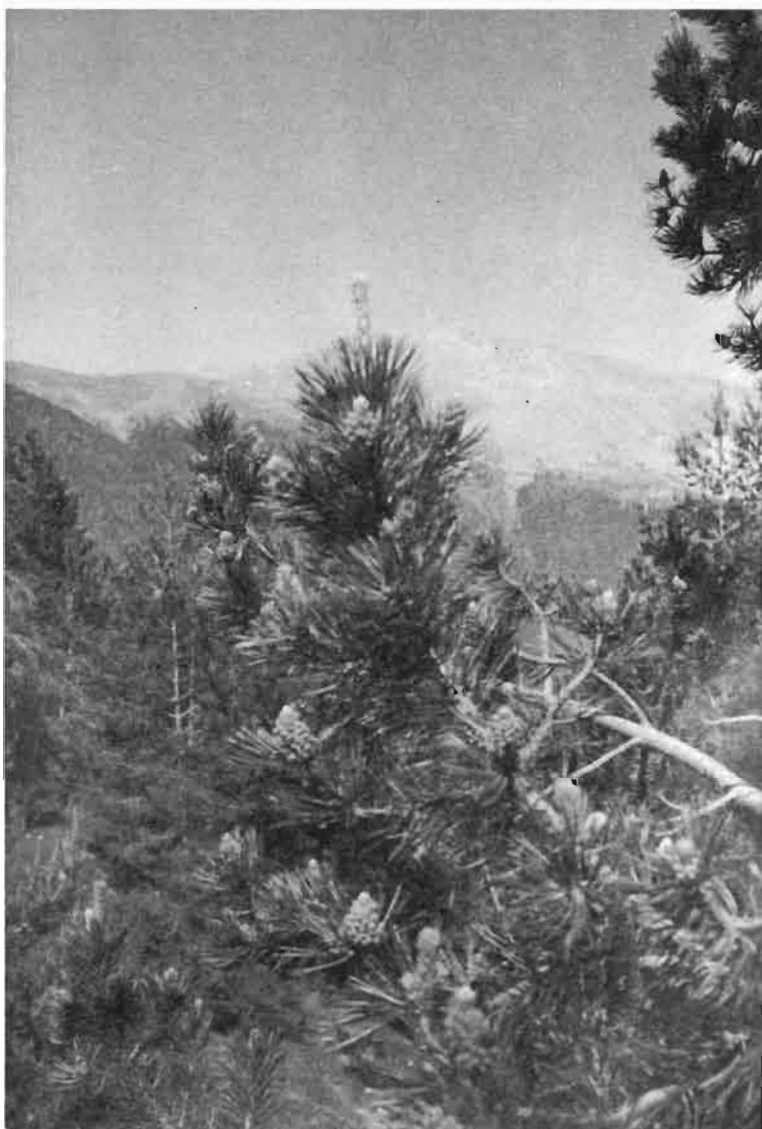
Pino en flor. Monte de Plan (mayo 1986). "Las covarchas". Al fondo, la sierra de Chía.