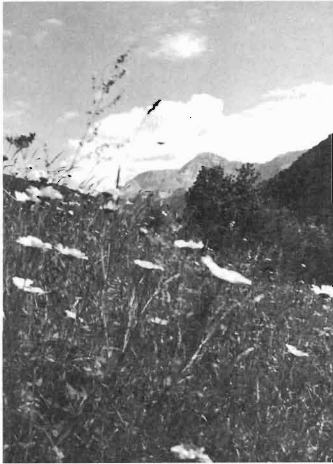
La Usera. San Juan de Plan. Un prado a finales de junio. Margaritas, lirios y hierba larga.