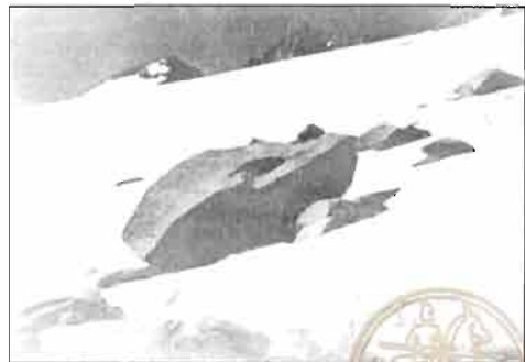
Foto 4. Benasque. Glaciar del Aneto.