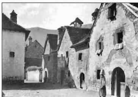
Foto 6. Ansó. Una plaza típica.