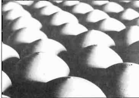
Foto 7. Efectos de luz sobre los botijos.

juega tanto con la luz, como con los encuadres, consiguiendo fotografías de gran valor artístico, sobre todo cuando se acerca a objetos como cántaros, barriles, cucharas o tejas y los fotografía en un primer plano.