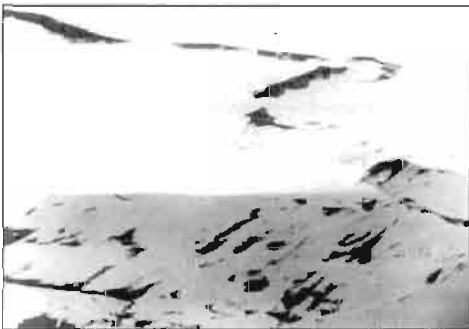
Foto 3. Sallent de Gállego. Barranco Bacarrizal.