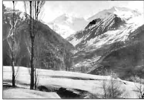
Foto 2. Nieve en la montaña. El Formigal.