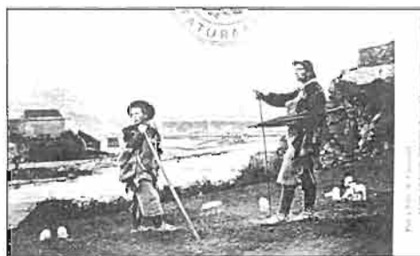
Foto 9. Tipos chesos pastoreando.