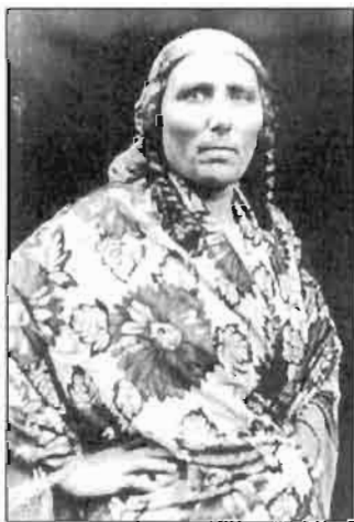
Foto 10. Húngaros. Caldereros húngaros. Busto de mujer.

Cuando fotografía a sus individuos no pretende hacer fichas etnográficas de tipos, o un inventario minucioso de rostros, sino que su deseo es el de retratar al campesino desde un punto de vista cercano, respetuoso y amable, sin buscar expresiones