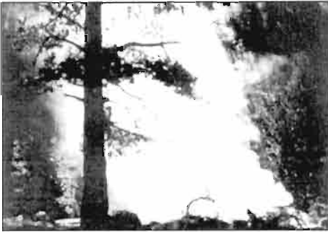
Foto 1. Plan. Efectos de luz a través de los pinos.