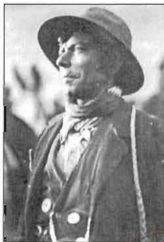
Foto 11. Huesca. Gitano custizo.