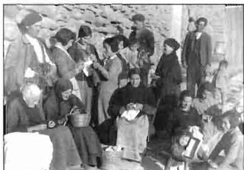
Foto 8. Bolea. Ambiente de trabajo.