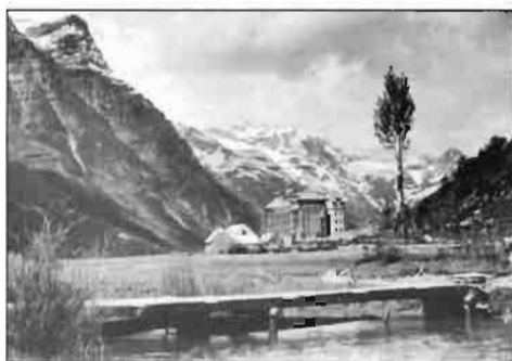
Foto 5. Alto Aragón. Bielsa. Valle de Pineta.