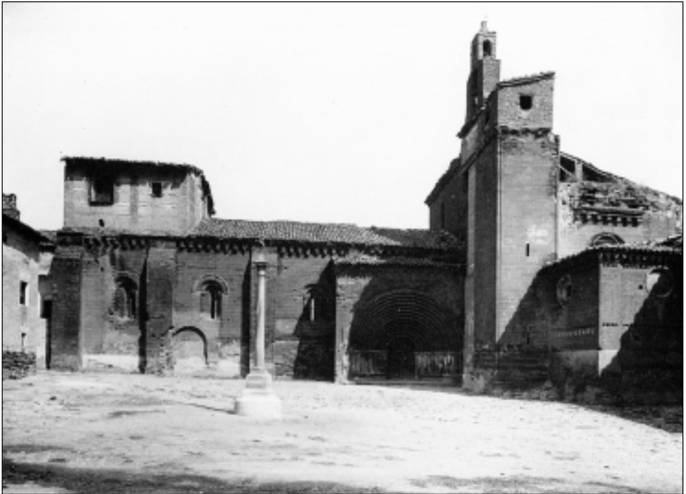
Fachada meridional y portada de la iglesia del monasterio de Sijena.

La reina doña Sancha y su esposo don Alfonso, no contentos con dotar espléndidamente al monasterio, le hicieron donación de una de sus hijas, la infanta doña Dulce, como religiosa fundadora. Más aún, la soberana de Aragón y Cataluña se