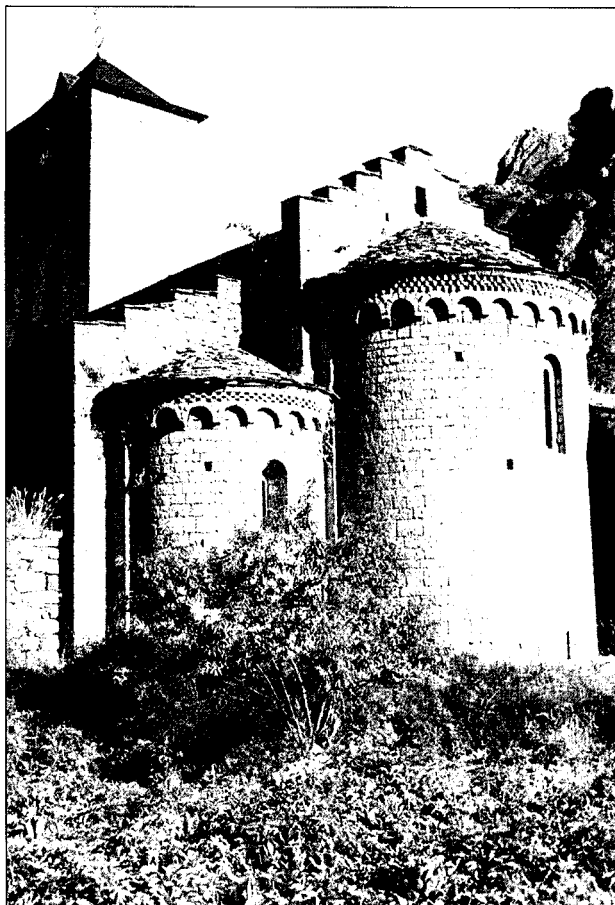
Santa María de Alaón. Ábsides y torre del abad (siglos XII-XIV).

esta fecha, el cenobio se nos ofrece muy floreciente, con sus abades y una comunidad numerosa. Se trata de una fundación en su origen medio condal-real, bajo la protección de los condes de Tolosa, por quienes la comunidad deberá orar. La cella de Santa María dependió directamente de los obispos de Urgel, según testifica el acta de consagración de su catedral (839). La dependencia a Urgel y Roda se deriva de la organización religiosa de Ribagorza-Pallars, basada en el sometimiento de los centros monásticos a los prelados, según vetusta organización visigótica del país. Los monjes, al parecer, siguieron la regla asanense o de san Victorián, patriarca de los monjes altoaragoneses, o tal vez el Pactum visigótico. La regla de san Benito entró en Alaón el año 954 y fue observada hasta la exclaustración (1836).