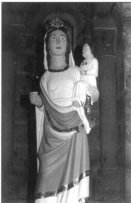
Imagen de Santa María de Chalamera. Reproducción de la destruida en 1936. Era del siglo XIV.