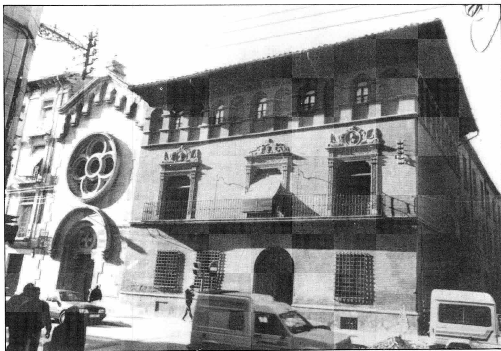
Casa de los Climent en la entrada de la judería.