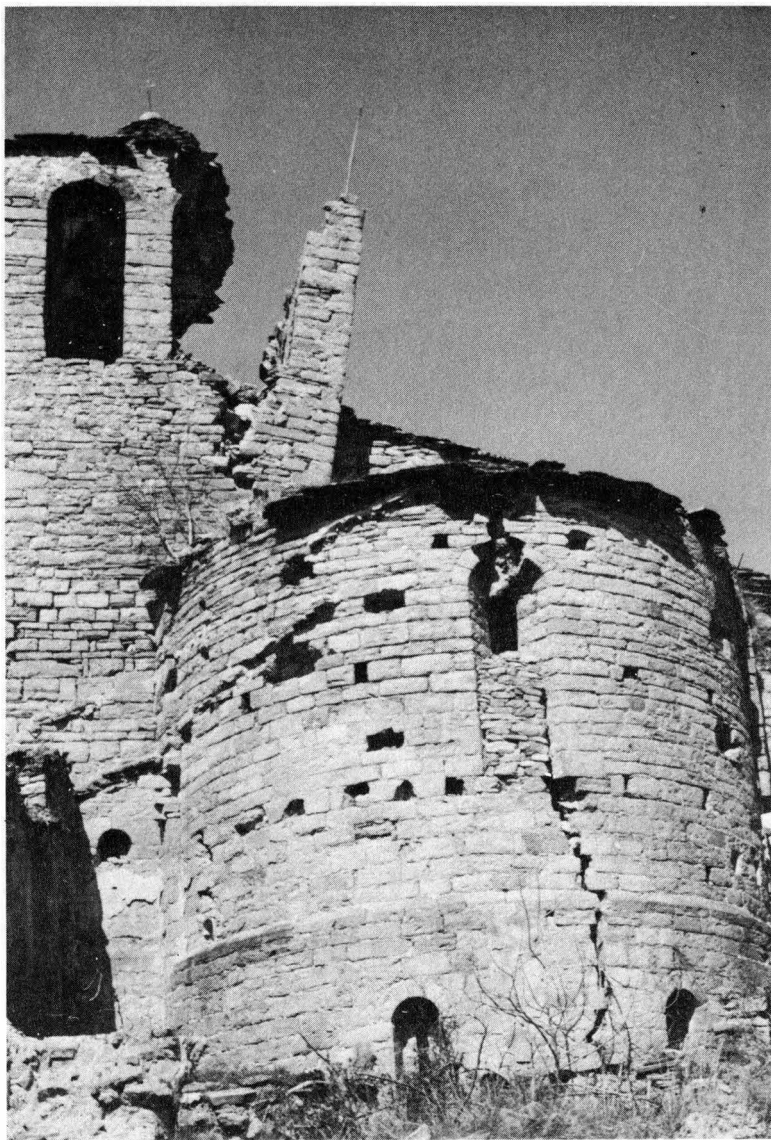
San Juan Evangelista de Besians.