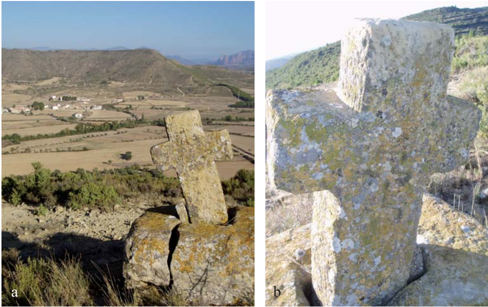
Figura 8. Cruz C06. a) La cruz mira a Losanglis desde el cordal que separa Bardaringo de la val de Vadiello. b) En su interior presenta una cruz grabada similar a la de la C05.

San Gil (ref. 1-INM-HUE-006-039-011), aunque el topónimo San Gil hace referencia a una zona diferente. Más adecuado sería identificarla como cruz del Paco de la Socarrada o de la Rinconada .