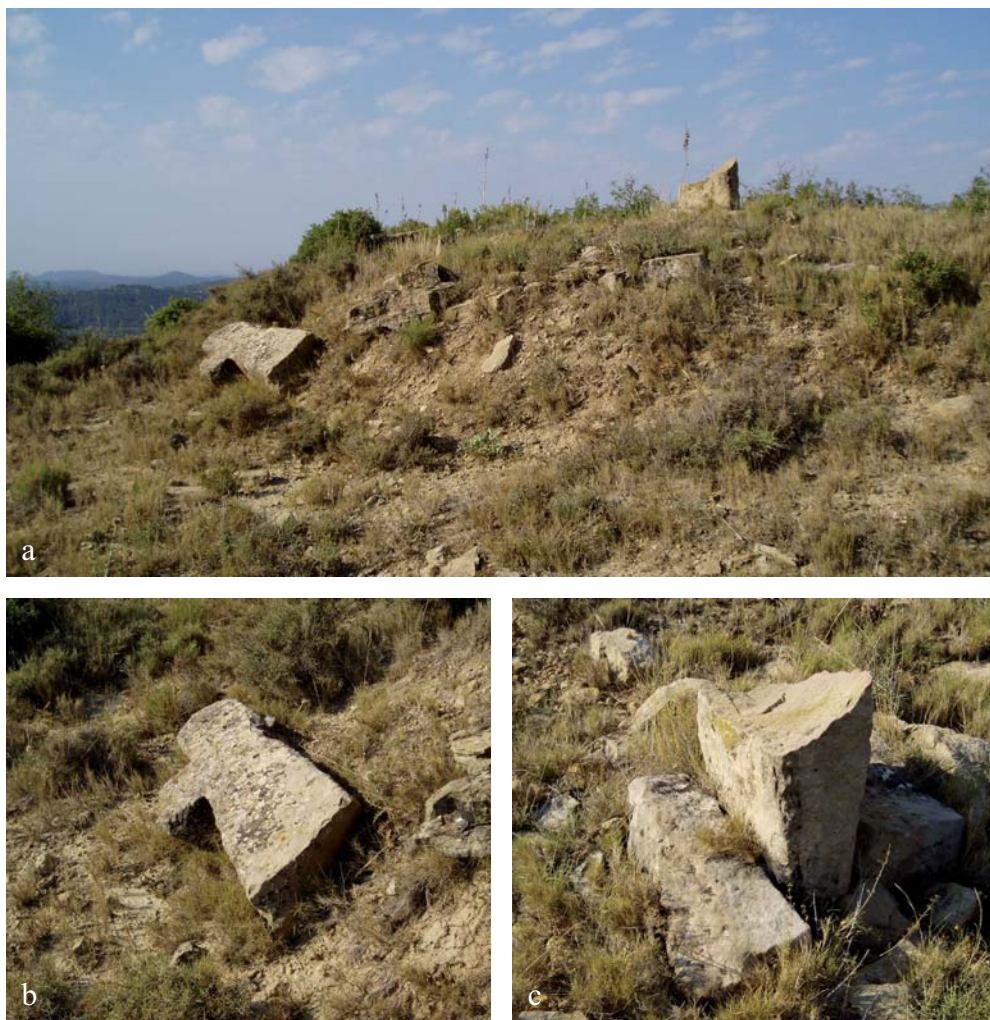
Figura 3. Cruz C01. a) Cruz seccionada por su base en el cordal de Valderrasal. b) Detalle: uno de los brazos de la cruz está roto. c) El basamento está realizado con bloques toscos rectangulares.