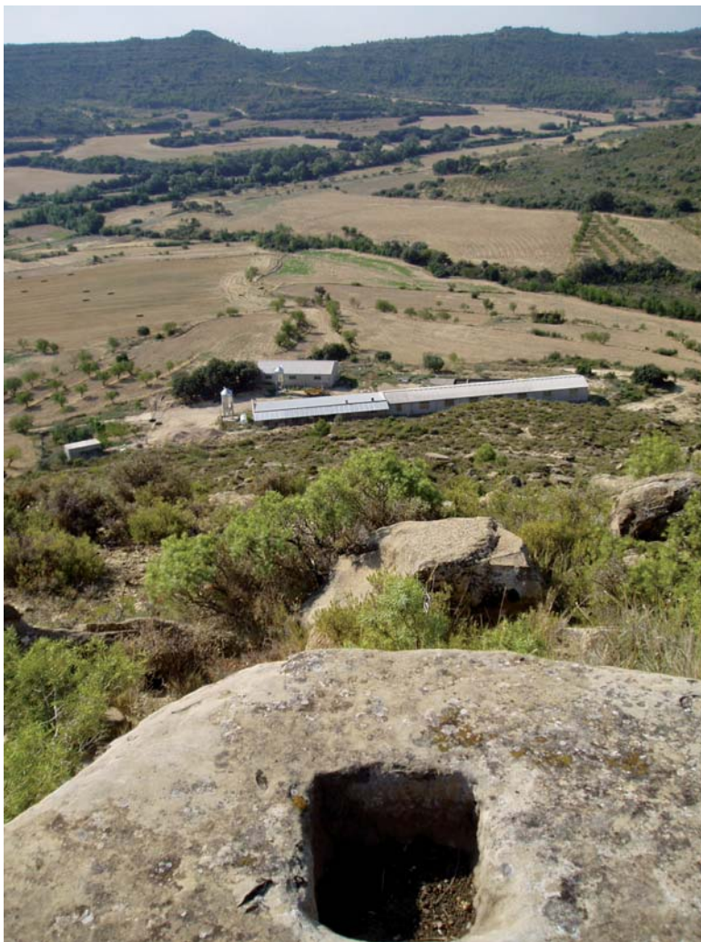
Figura 5. Posible encastrado de la cruz C03. Al fondo, la val del río Vadiello.