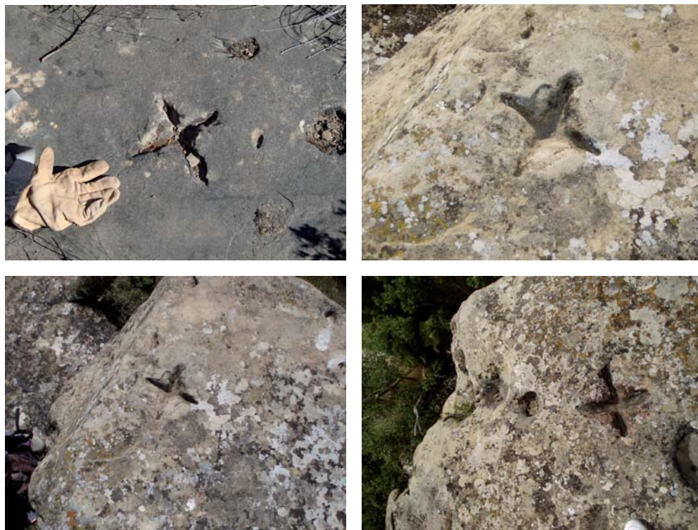
Figura 14. Ejemplos de cruces grabadas sobre roca.

más cercano u otra fecha próxima. Así, en Biscarrués se realiza una bendición similar desde la ermita de Santa Quiteria en el día de su festividad, el 22 de mayo.