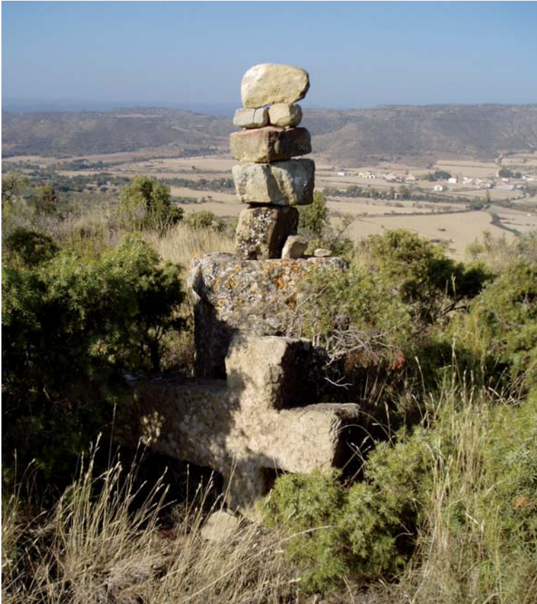
Figura 9. Cruz C07. La cruz se encuentra en el suelo y en su lugar hay un mojón de piedras. Al fondo, Losanglis.