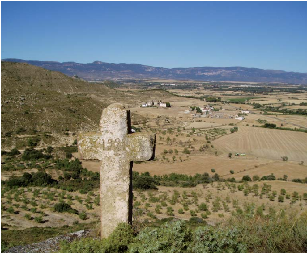
Figura 6. Cruz C04, catalogada como cruz de Mayo. Al fondo, Losanglis.

envergadura. Está pintada de blanco, posiblemente para facilitar su localización desde el pueblo. La fecha inscrita en su interior, 1921, parece indicar el año en que se colocó. Es de suponer la existencia de una cruz mucho más antigua que fue sustituida por la actual. Esta inscripción atestigua que los ritos relacionados con las cruces estaban activos en los años veinte del siglo XX. Está catalogada por el Sipca como cruz de Mayo (ref. 1-INM-HUE-006-039-009). Presenta un buen estado de conservación.