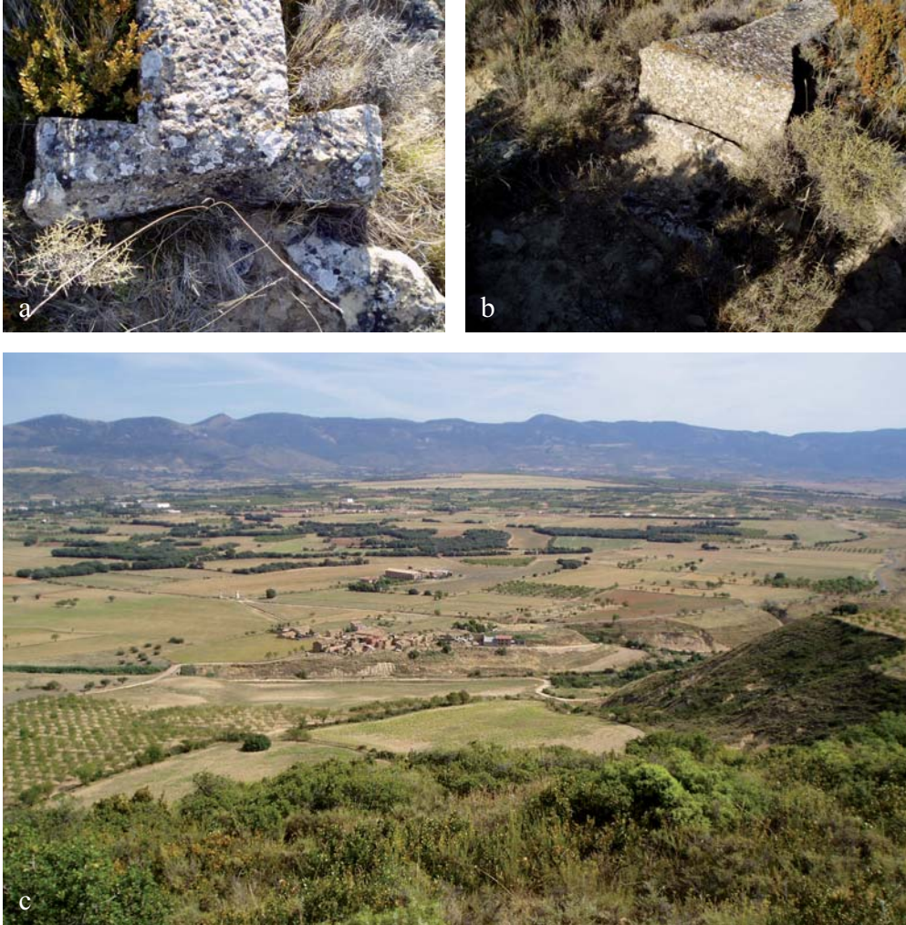
Figura 10. Cruz 08. a) Detalle del puente de la cruz: la parte superior ha desaparecido. b) Detalle del pie y el basamento de la cruz de Fontellas, que se encuentra derribada. c) Vista de Fontellas desde el emplazamiento de la cruz.

Su descubrimiento fue casual, ya que no se suponía la existencia de cruces en esta zona. El hallazgo abrió nuevas posibilidades que fueron apoyadas al conocerse mediante los libros parroquiales de Losanglis que ambas localidades formaban una sola parroquia.