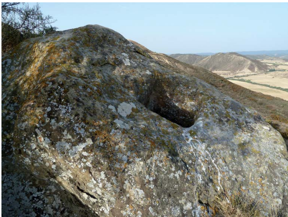
Figura 11. Cruz C09. Encastre en roca de la posible cruz de Monzorrobal.