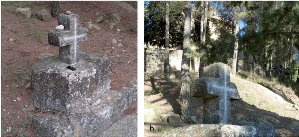
Figura 13. Cruz C11. a) Cruz de la Virgen de Casbas. b) Al fondo, la ermita.