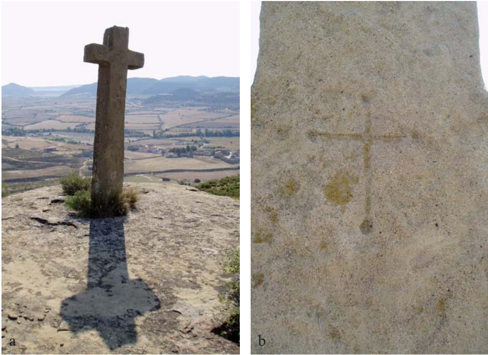
Figura 4. Cruz C02, catalogada como cruz de piedra. Al fondo, Losanglis. A la derecha, detalle de la cruz grabada en la cruz.

Está encastrada en una gran laja de roca horizontal. Sus brazos están orientados siguiendo la dirección del cordal y tiene una altura de 2 metros. En su interior presenta una cruz grabada cuyos brazos acaban en círculos. Está catalogada por el Sipca como cruz de piedra (ref. 1-INM-HUE-006-039-010). Presenta un buen estado de conservación.