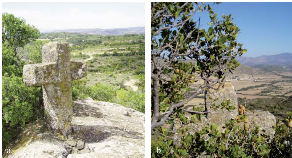
Figura 7. Cruz C05. Está encastrada en la roca y se encuentra mirando a Losanglis.

Sus dimensiones son 1 metro de altura, 0,70 de envergadura y 0,22 de grosor. En su interior tiene grabada una cruz similar a la de la C06. En los planos superiores presenta cruces toscas grabadas. Se encuentra prácticamente cubierta por la vegetación (coscoja), que la oculta de las miradas y defiende el acceso (fig. 7b).