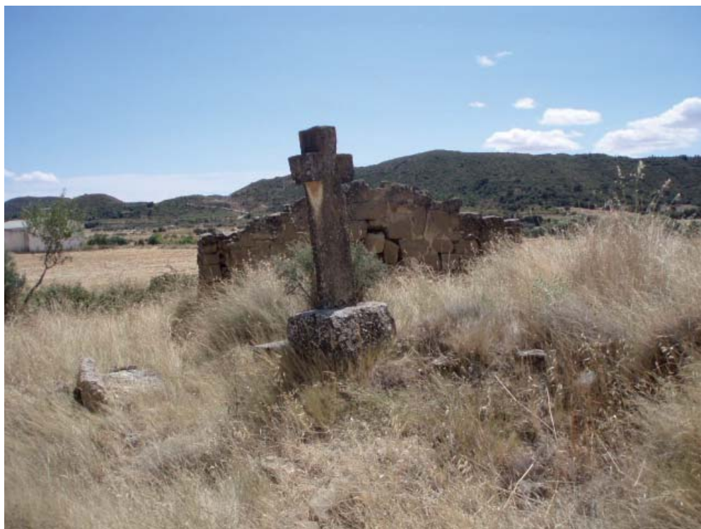
Figura 12. Cruz C10, la cruz de la Caseta d'os Pobres.

Se trata de una de las cruces grandes del conjunto. Tiene un pedestal cúbico y está ligeramente inclinada. Está catalogada en el Sipca como cruz de los Pobres (ref. 1-INM-HUE-006-039-008).