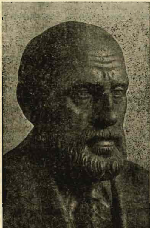
Busto de Ramón y Cajal en el vestíbulo del Instituto de Huesca. Obra del escultor Vicente Vallés.

llante porvenir anunciaban por el mundo varios heraldos. No, España no tiene histólogos, me dije; pues estudiemos la histología. Ella me ofrecía anchuroso campo. Por patriotismo, sólo por patriotismo,